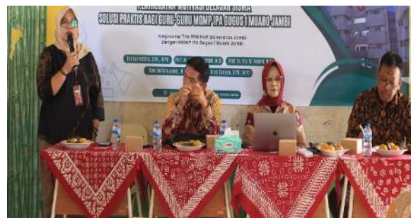
Gambar 2. Kegiatan Pembukaan

Workshop Optimasi Peran AI untuk Penyusunan Modul Ajar Deep Learning Bagi Guru IPA SMP di Kabupaten Muaro Jambi telah berhasil dilaksanakan. Kegiatan ini diikuti oleh 24 orang guru mata pelajaran IPA yang tergabung dalam MGMP IPA Gugus 1 Kabupaten Muaro Jambi. Pada kegiatan workshop ini peserta kegiatan dibekali dengan informasi terkait pendekatan deep learning dan diajak untuk mengenal berbagai tools AI yang dapat mereka gunakan untuk merancang modul ajar yang bisa mereka gunakan dalam pembelajaran dengan deep learning . Selain itu, peserta juga dilatih untuk menggunakan tools AI yang telah diperkenalkan dalam merancang modul ajar deep learning . Keberhasilan pelaksanaan kegiatan dapat dilihat melalui dokumentasi kegiatan. Kegiatan dimulai dengan pembukaan (Gambar 2) dan dilanjutkan dengan seminar dan workshop (Gambar 3).