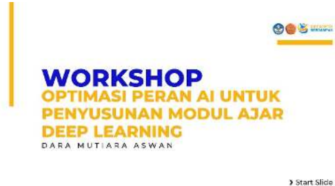
Gambar 4. Media yang Digunakan untuk Menyampaikan Materi

Materi pengabdian berupa pendekatan deep learning dan tools AI yang dapat dimanfaatkan dalam menyusun modul ajar deep learning disampaikan oleh tim pengabdian kepada masyarakat menggunakan media slide power point presentation (Gambar 4). Media ini dipilih karena menarik dan terbukti dapat meningkatkan minat dan motivasi peserta (Wulandari, 2022).