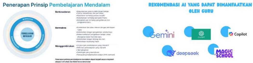
Gambar 5. Topik yang Disampaikan, (a) Deep Learning , (b) Tools AI yang dapat dimanfaatkan

Topik kedua yaitu tools AI yang dapat digunakan untuk menyusun modul ajar deep learning (Gambar 5b). Penggunaan teknologi AI ini dapat mengurangi tantangan dalam implementasi deep learning dalam pembelajaran. Teknologi AI dapat membantu guru dalam meningkatkan keterampilan mengajar, pengembangan profesional, serta memberikan dukungan dalam penilaian dan manajemen pembelajaran (Rusman et al., 2024). Penggunaan tools AI dalam merancang pembelajaran dengan pendekatan deep learning , dapat membantu guru dalam menyesuaikan kegiatan pembelajaran dengan kebutuhan murid. Fajriati et al., (2024) menyatakan bahwa penggunaan AI dalam mempersonalisasi pembelajaran pada akhirnya dapat membantu memenuhi kebutuhan individual secara lebih efektif.