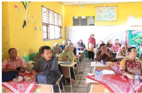
Gambar 7. Antusiasme Peserta Pelatihan dalam Menyimak Materi

Selama kegiatan berlangsung, guru-guru terlihat sangat antusias. Hal ini terlihat dari keterlibatan aktif peserta dalam menyimak pemaparan materi, serta antusiasme dalam mencoba menggunakan tools AI untuk merancang modul ajar deep learning (Gambar 7). Dapat dikatakan bahwa peserta kegiatan telah memahami dan dapat mengaplikasikan pengetahuan yang diperoleh pada saat kegiatan. Melalui pemahaman guru terkait pemanfaatan AI ini diharapkan dapat meningkatkan efektivitas dan efisiensi pembelajaran. Sejalan dengan hasil penelitian Afrita (2023), yang menyatakan bahwa AI mampu meningkatkan efisiensi dan efektivitas sistem pendidikan dengan mempercepat serta mempermudah proses pembelajaran dan manajemen data.