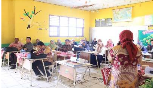
Gambar 3. Penyampaian Materi Kepada Peserta

Kegiatan luring dilaksanakan di MGMP IPA Gugus 1 Kabupaten Muaro Jambi dengan metode ceramah dan tutorial. Materi yang disampaikan oleh tim pengabdian kepada masyarakat yaitu pendekatan deep learning dan tools AI yang dapat digunakan oleh guru dalam merancang modul ajar deep learning .