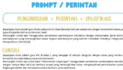
Gambar 6. Contoh Prompt yang Diberikan kepada Peserta Kegiatan

Dalam penyampaian materi terkait tools AI yang dapat dimanfaatkan oleh guru dalam pembelajaran, tim pengabdian kepada masyarakat juga memberikan contoh dan simulasi langsung cara membuat perintah ( prompt ) yang dapat digunakan dalam menggunakan AI (Gambar 6).