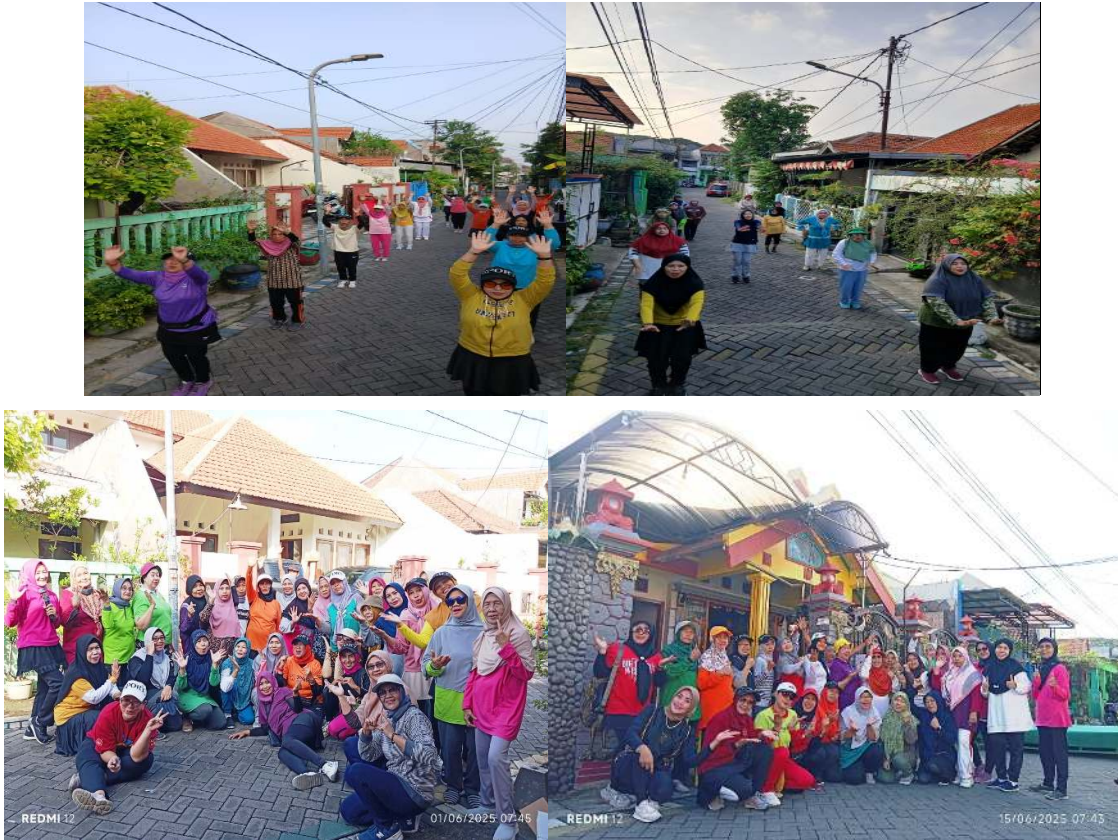
Gambar 2. Foto Kegiatan