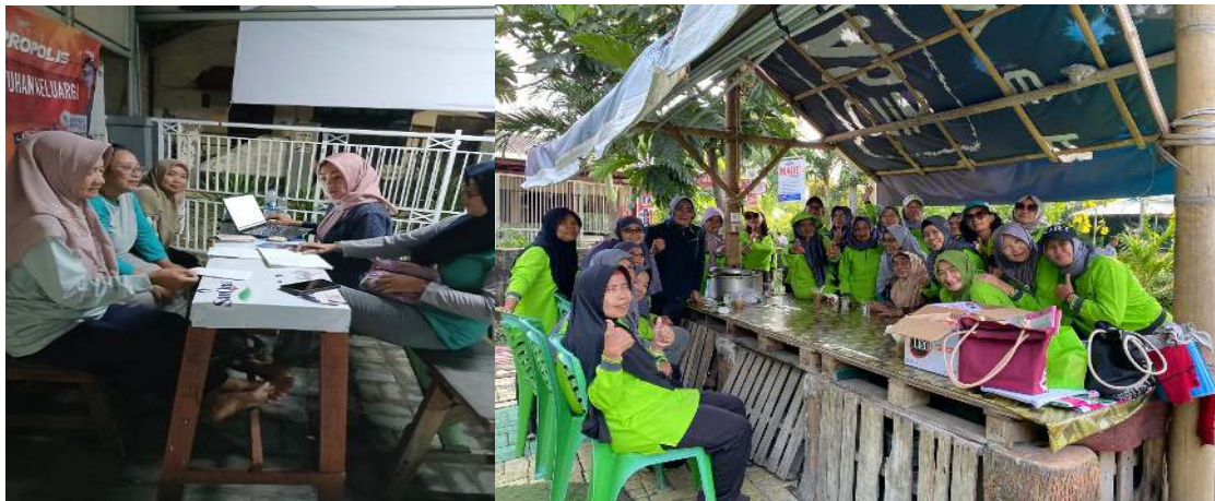
Gambar 1. Tahap Koordinasi dan Pemaparan Program

Kegiatan ini dimulai pada Minggu, 5 Mei 2025, di salah satu lokasi jalan Pagesangan. Latihan senam berlangsung sekitar lima puluh menit, dengan pemanasan, latihan inti, dan pendinginan dilakukan terakhir. Perencanaan dilakukan melalui koordinasi dengan pengurus RT/RW setempat dan tokoh masyarakat untuk menentukan waktu, lokasi, serta sasaran peserta senam. Selain itu, disiapkan pula materi edukasi tentang pentingnya senam bagi kesehatan fisik dan mental.