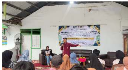
Gambar 2. Sosialisasi Narasumber Pertama