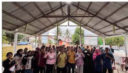
Gambar 1. Pembukaan Kegiatan

Kegiatan ini dimulai dengan sambutan dari Sekretaris Desa Buhu dan dilanjutkan dengan pejabat setempat, setelah itu Dosen Pembimbing Lapangan 1 menjelaskan tujuan dan pentingnya program ini. Ditekankan bahwa pelatihan ini tidak hanya akan membekali peserta pengetahuan etika bermedia sosial yang baik, tetapi juga menambah wawasan tentang nilai-nilai kearifan lokal yang tetap harus dilestarikan dalam kehidupan bermasyarakat.