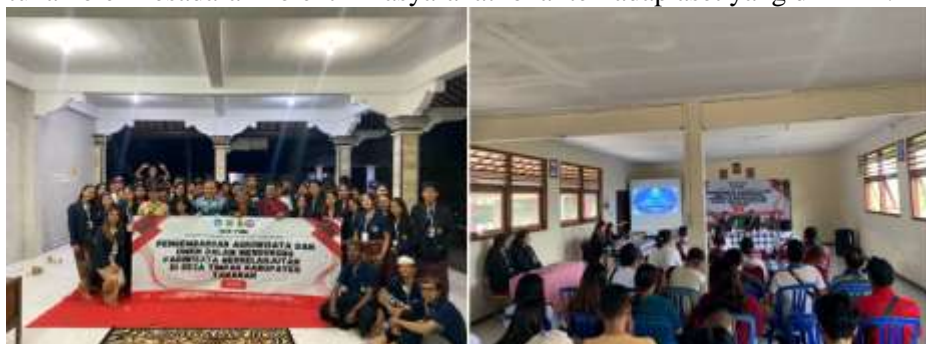
Gambar 1. Dokumentasi Pelaksanaan Kegiatan Pengabdian Di Desa Timpag

Kegiatan pengabdian masyarakat yang dilaksanakan di Desa Timpag menunjukkan sejumlah capaian penting dalam upaya mewujudkan desa wisata yang berdaya dan berkelanjutan. Salah satu hasil utama adalah meningkatnya kesadaran masyarakat mengenai pentingnya pariwisata berbasis potensi lokal. Melalui sosialisasi, diskusi kelompok terarah, dan pelatihan, masyarakat mulai menyadari bahwa sektor pertanian, budaya, serta usaha mikro kecil dan menengah (UMKM) dapat memberikan nilai tambah ekonomi apabila dikelola dengan baik sebagai bagian dari ekosistem pariwisata. Hal ini sesuai dengan pandangan Scheyvens (1999) yang menekankan bahwa keberhasilan community based tourism sangat ditentukan oleh kesadaran kolektif masyarakat lokal terhadap aset yang dimiliki.