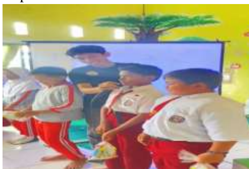
Gambar 1. Interaksi antara Siswa dan Pemateri

Salah satu hasil paling menonjol dari kegiatan sosialisasi ini adalah tingkat partisipasi dan antusiasme peserta yang melampaui ekspektasi. Sejak awal acara, seluruh siswa dari kelas 4, 5, dan 6 menunjukkan atensi penuh terhadap materi yang disajikan. Suasana di dalam ruangan sangat hidup dan dinamis, membuktikan bahwa topik perundungan merupakan isu yang relevan dan menarik bagi mereka. Antusiasme ini tidak hanya pasif, tetapi juga termanifestasi dalam keterlibatan aktif selama sesi interaktif. Para mahasiswa pelaksana sengaja merancang sesi tanya jawab dan kuis untuk mendorong keberanian siswa dalam mengemukakan pendapat. Metode ini terbukti sangat efektif. Banyak siswa yang dengan semangat mengangkat tangan untuk menjawab pertanyaan. Momen puncak dari interaksi ini adalah ketika beberapa siswa secara sukarela maju ke depan untuk berbicara menggunakan mikrofon, menjawab pertanyaan studi kasus, atau menceritakan pemahaman mereka. Keberanian mereka untuk tampil di hadapan teman-temannya merupakan indikator kuat bahwa kegiatan ini berhasil menciptakan ruang aman yang membuat mereka merasa nyaman dan dihargai. Sebagai bentuk apresiasi, hadiah-hadiah kecil diberikan kepada mereka yang aktif, yang semakin meningkatkan semangat kompetisi sehat dan kegembiraan di antara para peserta.