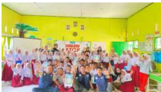
Gambar 3. Sesi foto Bersama Mahasiswa KKN Universitas Muhammadiyah Bone dengan para siswa

Keberhasilan program ini tidak terlepas dari adanya kolaborasi dan dukungan penuh dari pihak SDN 253 Padatuo. Sejak tahap perencanaan, Kepala Sekolah dan jajaran guru menyambut baik inisiatif mahasiswa KKN dan memberikan kemudahan akses serta fasilitas yang dibutuhkan. Selama acara berlangsung, para guru turut mendampingi siswa, membantu menjaga kondusivitas, dan memberikan penguatan positif terhadap pesan-pesan anti-perundungan yang disampaikan. Respon positif ini terangkum secara visual dalam sesi foto bersama di akhir acara. Momen tersebut menangkap kehangatan dan kebersamaan antara mahasiswa, guru, dan seluruh siswa peserta. Senyum dan gestur antusias dari para siswa menjadi cerminan dari keberhasilan acara. Secara verbal, Kepala Sekolah menyampaikan apresiasi mendalam dan mengakui bahwa metode pembelajaran yang interaktif sangat efektif untuk siswa di tingkat sekolah dasar. Beliau juga mengungkapkan harapan besar agar kegiatan positif semacam ini dapat terus berlanjut di masa depan sebagai bagian dari upaya bersama untuk mewujudkan sekolah yang aman, nyaman, dan berkarakter.