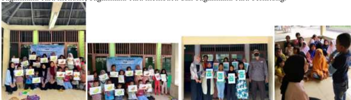
Gambar 1 – 4. Gambar 2. Foto Bersama Anak – Anak Kecamatan Bekasi utara lingkungan RW 08 Kelurahan Marga Mulya pada saat melakukan kegiatan pembelajaran.

Para mahasiswa KKN merealisasikan program kerja dalam pendidikan formal sebagai tenaga pengajar di Kecamatan Bekasi utara Kota Bekasi provinsi Jawa Barat, lingkungan RW 08 Kelurahan Marga Mulya. Sarana yang digunakan dalam mendukung kegiatan mengajar tersebut adalah buku alat tulis seperti pulpen, pensil, penggaris, penghapus dan papan tulis. Kegiatan mengajar di Kecamatan Bekasi utara Kota Bekasi provinsi Jawa Barat, lingkungan RW 08 Kelurahan Marga Mulya dilakukan secara terjadwal yaitu pada hari sabtu tanggal 09 Desember 2024, 16 Desember 2024 dan 17 Desember 2024 setiap pukul 08.30-11.00 WIB. Berperan sebagai tenaga pengajar di Kecamatan Bekasi utara Kota Bekasi provinsi Jawa Barat, lingkungan RW 08 Kelurahan Marga Mulya memiliki tantangan tersendiri bagi mahasiswa KKN sebab anak-anak di lokasi ini harus memiliki bimbingan ekstra dari guru atau orang tua sebab mereka masih pengenalan terhadap pembelajaran baik bagaimana memegang alat tulis, bagaimana cara menulis, bagaimana cara membaca dan bagaimana cara berhitung.