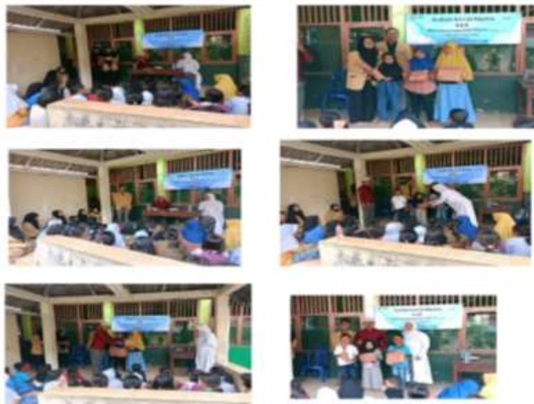
Gambar 1 – 6. Gambar 3. Foto Bersama Anak – Anak Kecamatan Bekasi utara Kota Bekasi provinsi Jawa Barat, lingkungan RW 08 Kelurahan Marga Mulya pada saat melakukan kegiatan Perlombaan

Selain peran utamanya sebagai tenaga pengajar, mahasiswa dan dosen yang terlibat dalam program Kuliah Kerja Nyata (KKN) juga memiliki kesempatan untuk menyelenggarakan berbagai kegiatan lain yang dapat mendukung pengembangan kualitas pendidikan di masyarakat. Salah satu kegiatan yang tidak kalah penting dalam program KKN adalah penyelenggaraan kompetisi atau perlombaan, yang bertujuan untuk mendorong kreativitas, meningkatkan motivasi belajar, serta mempererat hubungan antara mahasiswa dan masyarakat, khususnya para siswa ditempat mereka mengabdikan. Rangkaian kegiatan KKN yang melibatkan pengajaran dan kompetisi perlombaan diharapkan dapat memberikan dampak yang lebih luas dan menyeluruh dalam membentuk generasi muda yang cerdas, kreatif, dan kompetitif. Perlombaan dan Kompetisi Pendidikan Lomba Pengetahuan Umum yaitu Perlombaan yang menguji kemampuan siswa dalam bidang pengetahuan umum Cerdas Cermat. Lomba ini dapat mendorong siswa untuk lebih mendalami materi pelajaran dengan cara yang menyenangkan dan kompetitif.