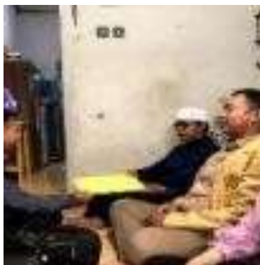
Gambar 1. Kunjungan ke rumah Pak RW 08 untuk konfirmasi bahwa ada kegiatan KKN yang akan di lakukan oleh mahasiswa/i dari Ubhara Jaya, serta berdiskusi terkait program apa saja yang ada di rw 08.