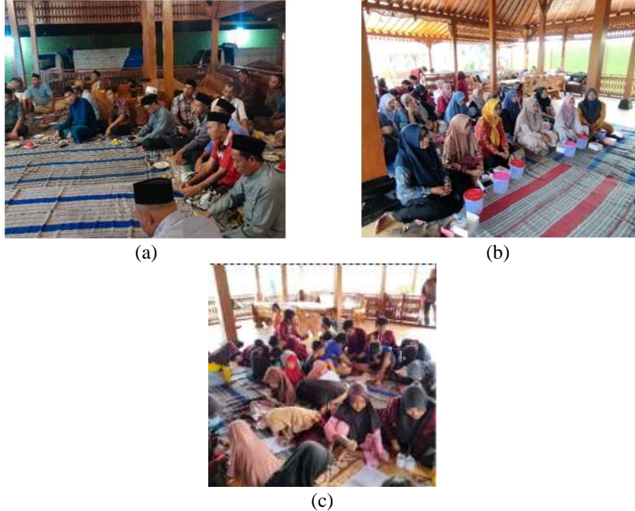
Gambar 3. (a) Segmen Bapak-Bapak (b) Segmen Ibu-Ibu (c) Segmen Anak-Anak

Program Kampung Iklim tidak hanya berfokus pada pengelolaan sampah, tetapi juga pada langkah mitigatif melalui segmen bapak-bapak. Kegiatan ini memiliki muatan materi mitigasi bencana banjir rob sebagai upaya meningkatkan kesiapsiagaan. Pertemuan pertama pada 7 September 2025 membahas pengenalan banjir rob, penyebab, serta dampaknya yang dirasakan warga dan pertemuan kedua pada 28 September 2025 dilanjutkan dengan materi strategi mitigasi sederhana untuk mengurangi kerugian.