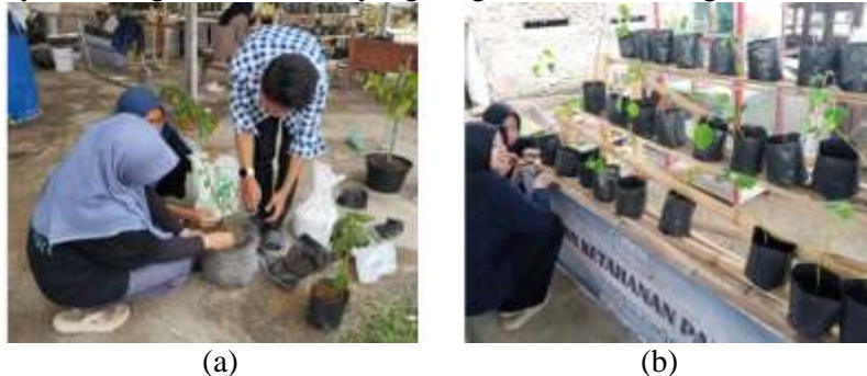
Gambar 4. (a) Pemindahan Tanaman Ke Pot (b) Taman Ketahanan Pangan

Program Taman Ketahanan Pangan merupakan perwujudan nyata dari dua program sebelumnya yaitu Ruang Iklim dan Bank Sampah Digital, di mana hasil pengolahan sampah organik dimanfaatkan secara optimal melalui kompos sebagai media tanam padat dan air lindi sebagai pupuk cair organik. Hal ini sejalan dengan pernyataan (Pranata et al., 2021) bahwa sampah organik sangat potensial untuk dijadikan kompos, yaitu sebagai biofertilizer yang sangat bermanfaat bagi tanaman.