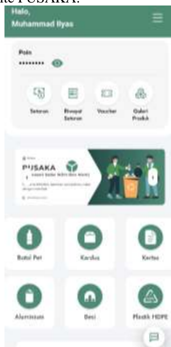
Gambar 1. Tampilan Dashboard Website PUSAKA

Sampah adalah permasalahan dunia yang harus dicari solusinya Bersama. Data dari bank dunia memperlihatkan bahwa Kawasan Asia menempati peringkat pertama penyumbang sampah terbesar (Yusuf et al., 2023). Pengolahan sampah yang baik akan menghasilkan keluaran yang bermanfaat serta bernilai ekonomis sesuai dengan tujuan ekonomi sirkular, agar sisa konsumsi tidak berakhir di Tempat Pembuangan Akhir (TPA) (Utami et al., 2021). Prinsip inilah yang menjadi dasar hadirnya Bank Sampah Digital, melalui inovasi ini sistem pengelolaan sampah tidak lagi berhenti pada tahap pengumpulan, tetapi diarahkan pada proses pemilahan sampah sehingga tercipta dua jalur utama pengolahan. Sampah organik yang akan menjadi media tanam dan Sampah Anorganik bernilai yang akan di konversikan pembayaran air bersih melalui website PUSAKA.