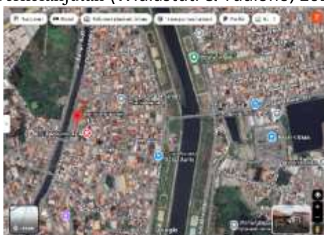
Gambar 1 Lokasi Kelurahan Mlatiharjo Semarang

Melalui kegiatan ini, warga dilibatkan secara aktif mulai dari proses pengumpulan, pencatatan hasil, hingga pengelolaan keuntungan yang diperoleh. Literasi keuangan akan menolong masyarakat mengelola hasil penjualan sampah untuk kegiatan yang lebih produktif. Salah satu upayanya dengan mengaplikasikan sistem pembukuan yang rapi dan transparan berbasis Ms Excel (Widiastuti et al., 2023). Pencatatan yang terstruktur bukan hanya memudahkan pengawasan keuangan bank sampah, tetapi juga menumbuhkan rasa saling percaya di antara anggota serta membuka peluang berkembangnya usaha berbasis komunitas. Dengan perpaduan antara literasi keuangan yang memadai dan pengelolaan administrasi yang baik, bank sampah dapat menjadi motor penggerak ekonomi warga sekaligus menjaga kelestarian lingkungan secara berkelanjutan (Widiastuti & Yudiono, 2024).