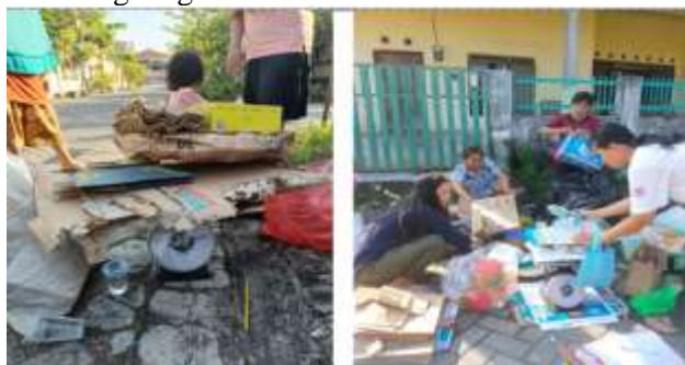
Gambar 2. Kegiatan Mengumpulkan dan Memilah Sampah

Hasil observasi di Kelurahan Mlatiharjo, Semarang, menunjukkan bahwa masyarakat setempat masih memiliki keterbatasan pengetahuan dalam pengelolaan keuangan sampah. Saat ini, kegiatan pengumpulan dan pemilahan sampah dilakukan setiap minggu ketiga, namun seluruh sampah yang terkumpul langsung dijual tanpa melalui proses pengolahan atau inovasi untuk meningkatkan nilai guna dan nilai jualnya. Hasil penjualan kemudian dimasukkan ke kas masing-masing RT, tetapi belum didukung oleh sistem pembukuan yang rapi dan dapat dipertanggungjawabkan. Kondisi ini menunjukkan perlunya edukasi literasi keuangan bagi warga agar mampu mengelola keuangan sampah dan mengembangkan inovasi pemanfaatan sampah yang dapat memberikan nilai tambah ekonomi sekaligus menjaga kelestarian lingkungan.