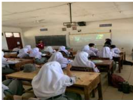
Gambar 2. Presentasi Materi

Gambar 1. Adalah kegiatan koordinasi dengan pihak sekolah yang dimana pihak sekolah menyambut baik program ini karena sejalan dengan kebutuhan siswa dalam menghadapi tantangan perkembangan teknologi. Kepala sekolah memberikan izin dan dukungan penuh terhadap pelaksanaan kegiatan.