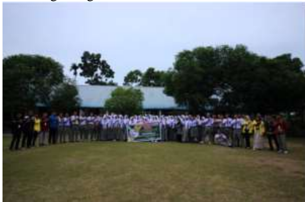
Gambar 4. Kegiatan foto bersama siswa/i

pengalaman mereka terkait penggunaan internet, masalah yang sering dihadapi serta pertanyaan mengenai hal-hal yang belum dipahami. Mereka sangat bersemangat dan antusias juga aktif dalam sesi tanya jawab dan sharing tentang pengalaman mereka. Melalui kegiatan Pengabdian kepada Masyarakat ini diharapkan dapat meningkatkan pola pikir Siswa-siswi agar lebih mengenal teknologi dan keamanan cyber serta menggunakan teknologi dengan baik.