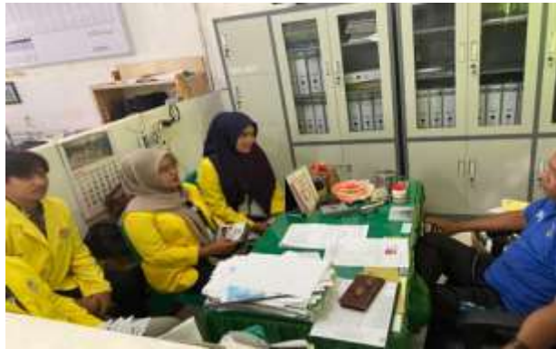
Gambar 1. koordinasi dengan pihak sekolah

Gambar 1. Adalah kegiatan koordinasi dengan pihak sekolah yang dimana pihak sekolah menyambut baik program ini karena sejalan dengan kebutuhan siswa dalam menghadapi tantangan perkembangan teknologi. Kepala sekolah memberikan izin dan dukungan penuh terhadap pelaksanaan kegiatan.