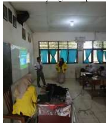
Gambar 3. Diskusi & Tanya Jawab

Gambar 2 adalah kegiatan penyampaian materi dimana materi presentasi yang disampaikan mencakup pengenalan tentang cyber, jenis-jenis ancaman cyber, dampak dari cyber, langkah-langkah pencegahan, serta peran penting pelajar dalam menjaga keamanan data pribadi di era digital. Para peserta juga diberi pemahaman mengenai tindakan yang harus diambil jika menghadapi serangan cyber. kegiatan ini berjalan dengan baik dan siswa/I sangat antusias dalam memahami pemahaman terhadap cyber terutama dalam penggunaan dan peningkatan dalam literasi digital, dimana penggunaan internet sangatlah memiliki faktor yang sangat penting terutama didunia digital pada saat ini. Selama presentasi, para siswa memperhatikan dengan serius materi yang disampaikan.