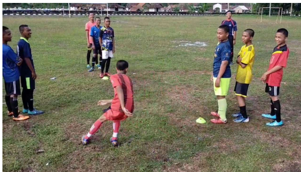
Gambar 3. Anak SSB Karangreja sedang latihan fisik berupa sprint