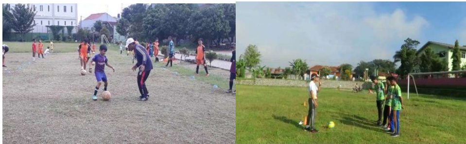
Gambar 2. Anak SSB Karangreja sedang latihan passing dan shooting