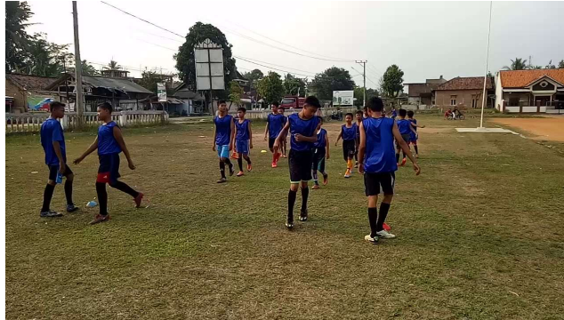
Gambar 1. Anak SSB Karangreja sedang latihan pemanasan