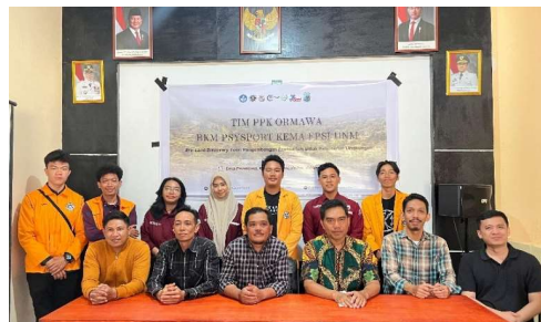
Gambar 3. Sosialisasi Program Kegiatan PPK Ormawa BKM PSYSPORT Kema F.Psi UNM

Sosialisasi dilakukan kepada pemerintah desa dan masyarakat setempat mengenai tujuan, manfaat, dan rencana program Ere-Land Discovery Tour . Kegiatan ini bertujuan untuk memperoleh dukungan dan partisipasi aktif dari masyarakat lokal.