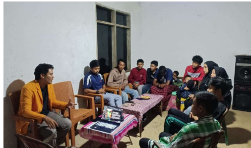
Gambar 4. Pembentukan Kelompok Sadar Wisata

Bersama dengan pemerintah desa dan masyarakat lokal, dilakukan proses pemilihan dan pembentukan anggota kelompok sadar wisata (pokdarwis).