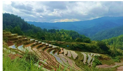
Gambar 2. Observasi Potensi Wisata Alam