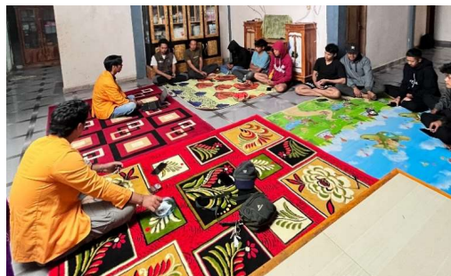
Gambar 5. Pelatihan dan Pendampingan Pokdarwis Dusun Biring Panting

Berdasarkan pelaksanaan pelatihan, peserta diminta untuk mengisi pre-post test . Berdasarkan diagram pada gambar 6, dapat ditarik kesimpulan bahwa peserta mengalami peningkatan pengetahuan setelah mengikuti kegiatan pelatihan.