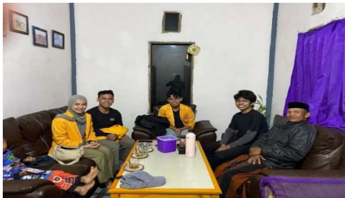
Gambar 1. Identifikasi Potensi Bersama Kepala Dusun

Hasil observasi awal menunjukkan bahwa Desa Erelembang memiliki potensi wisata alam yang tinggi, seperti hutan pinus, kebun kopi, panorama pegunungan, serta udara sejuk yang cocok untuk wisata alam. Dari wawancara dengan aparat desa dan tokoh masyarakat, diketahui bahwa masyarakat memiliki antusiasme tinggi untuk mengembangkan potensi wisata, tetapi masih membutuhkan pendampingan dalam aspek kelembagaan dan manajemen wisata. Temuan ini menguatkan pentingnya pembentukan Pokdarwis sebagai wadah formal yang dapat menampung aspirasi serta menggerakkan kegiatan wisata secara berkelanjutan.