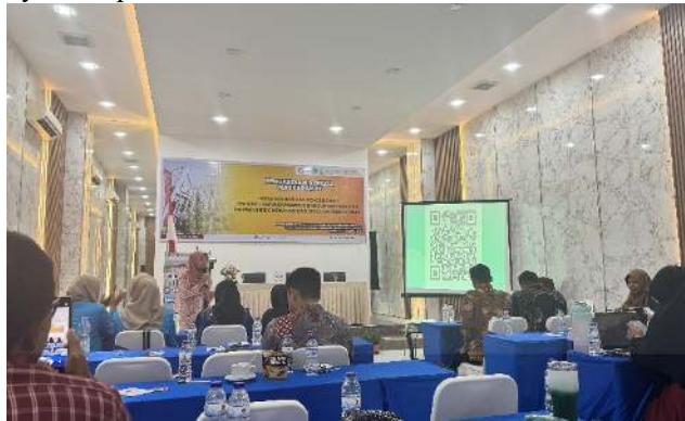
Gambar 3. Peserta diminta untuk mengisi kuesioner dengan memindai kode QR