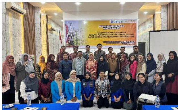
Gambar 4. Foto bersama tim PkM dan peserta