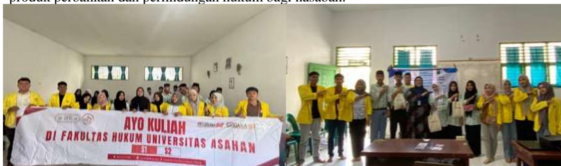
Gambar 3. Foto Bersama Peserta Sosialisasi Hukum