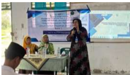
Gambar 2. Pelaksanaan Sosialisasi Hukum

Kegiatan Pengabdian kepada Masyarakat (PkM) dalam bentuk Sosialisasi Hukum Perbankan: Pengenalan Umum Terkait Pinjaman Uang (Kredit) Bank telah dilaksanakan di MAS Al-Washliyah Tanjung Balai pada bulan September 2025. Kegiatan ini dihadiri oleh Kepala Sekolah, guru, siswa-siswi kelas XI dan XII, serta narasumber dari tim dosen Fakultas Hukum Universitas Asahan yang didampingi mahasiswa pelaksana PkM.