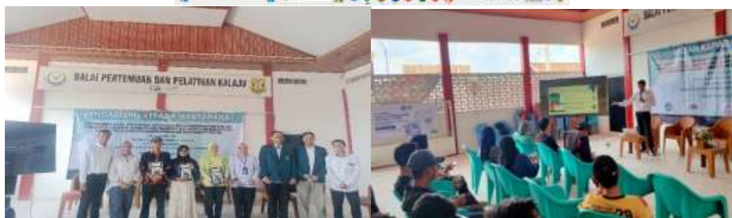
Gambar 1. Kegiatan Pengabdian