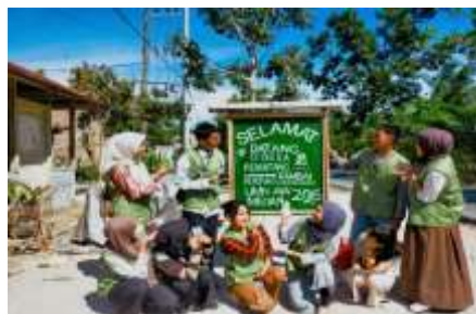
Gambar 8. Pembuatan dan Pemasangan Papan Selamat Datang di Desa Pematang Rambai