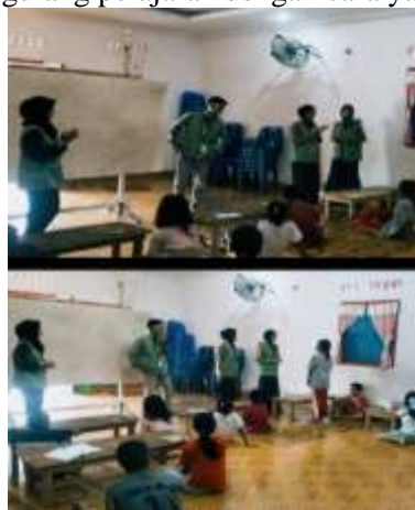
Gambar 2. Kegiatan BIMBEL bersama anak-anak Desa Pematang Rambai

Kegiatan bimbingan belajar (BIMBEL) ini dilaksanakan sebagai bentuk kepedulian terhadap peningkatan mutu pendidikan di lingkungan masyarakat. Program ini bertujuan untuk membantu siswa dalam memahami materi pelajaran yang mereka terima di sekolah, sekaligus memberikan pendampingan belajar tambahan di luar jam sekolah. Melalui kegiatan ini, siswa didorong untuk lebih aktif bertanya, berdiskusi, dan mengulang pelajaran dengan cara yang menyenangkan dan interaktif.