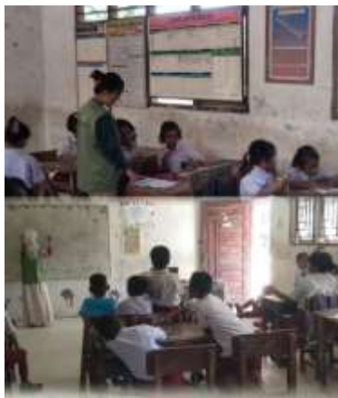
Gambar 1. Kegiatan mengajar di SD Desa Pematang Rambai

Pelaksanaan kegiatan dilakukan secara langsung di dalam kelas. Peserta berperan sebagai pengajar dan pendamping, dengan metode penyampaian materi secara interaktif melalui ceramah singkat, tanya jawab, latihan soal, serta pendampingan individu. Kegiatan ini dimulai dengan apersepsi untuk menarik perhatian siswa, dilanjutkan dengan penjelasan materi, dan diakhiri dengan latihan mandiri yang didampingi oleh peserta.