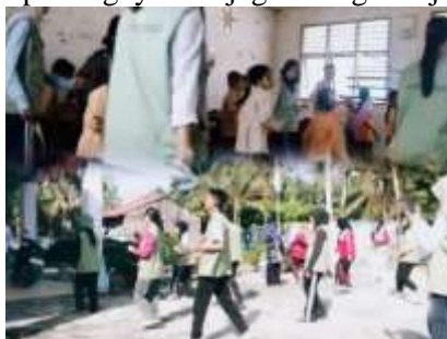
Gambar 3. Kegiatan senam bersama anak-anak serta masyarakat Desa Pematang Rambai

Pelaksanaan kegiatan dilakukan di area terbuka, dipandu oleh peserta dengan gerakan senam sederhana yang mudah diikuti oleh semua kalangan. Suasana kegiatan berlangsung aktif dan ceria, diiringi musik yang membuat peserta semakin antusias. Melalui kegiatan ini, diharapkan masyarakat dan siswa /i dapat lebih sadar akan pentingnya menjaga kebugaran jasmani secara rutin.