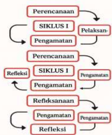
Gambar 1. Tahapan Siklus PTK

Proses penelitian ini menggunakan model Penelitian Tindakan Kelas (PTK) spiral dari Kemmis dan Taggart yang akan dilaksanakan selama bulan April tahun 2025 di kelas VIII-G SMPN 19 Malang dengan materi analisis data. PTK dilaksanakan selama 2 siklus dengan tiap siklus memiliki tahapan yang akan dilaksanakan sebagai berikut :