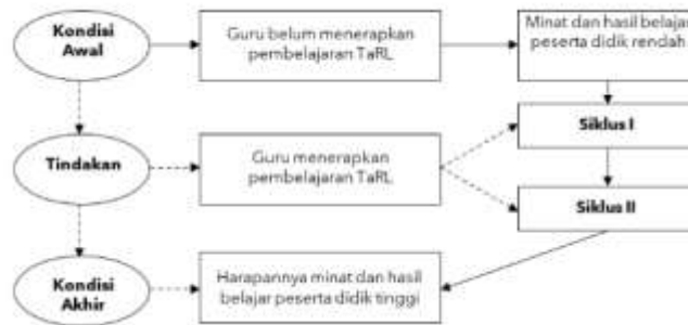
Gambar 2. Kerangka Berpikir

pendekatan tersebut, peserta didik dapat mampu mengikuti pembelajaran tanpa kehilangan minat dan menimbulkan rasa bosan. Dengan demikian, suasana pembelajaran akan optimal, efektif, dan menyenangkan. Kondisi ini diharapkan dapat meningkatkan hasil belajar peserta didik. Perhatikan kerangka berpikir pada gambar berikut :