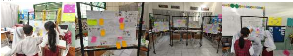
Gambar 3. Dokumentasi Kegiatan Window Shopping di Kelas

Peningkatan skor dan ketuntasan ini menunjukkan bahwa metode window shopping efektif dalam meningkatkan antusiasme siswa saat presentasi. Siswa tampak lebih percaya diri, aktif berdiskusi, dan menunjukkan ekspresi belajar yang positif. Selain itu, suasana kelas menjadi lebih dinamis, dengan lebih banyak siswa berani menyampaikan pendapat dan terlibat dalam diskusi kelompok. Hal ini konsisten dengan temuan Nurhalizah et al. (2024), yang menyatakan bahwa model window shopping mampu meningkatkan keaktifan, keberanian, dan partisipasi siswa melalui interaksi yang menyenangkan dan santai.