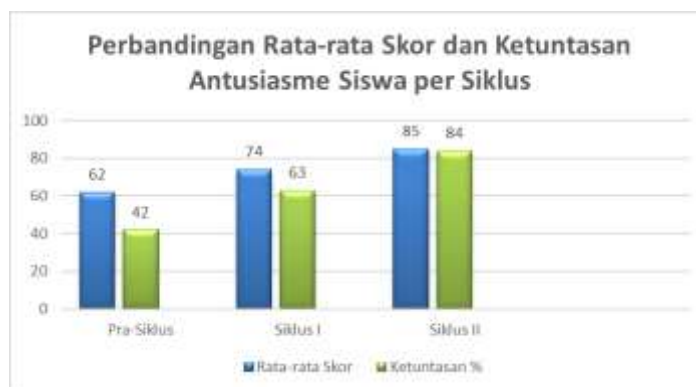
Gambar 2. Perbandingan Rata-rata Skor dan Ketuntasan Antusiasme Siswa

Angka rata-rata antusiasme ketika pra-siklus memperoleh skor 62 dengan tingkat ketuntasan belajar 42%. Setelah implementasi strategi window shopping ketika siklus I berlangsung, skor rata-rata naik ke angka 74 dan memperoleh ketuntasan mencapai 63%. Saat memasuki siklus II, rata-rata skor bertambah lagi hingga 85 dengan persentase ketuntasan 84%. Visualisasi komparasi nilai rata-rata serta persentase ketercapaian antusiasme siswa siswa dapat diamati pada Gambar 2 berikut: