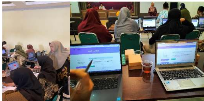
Gambar 3. Pendampingan menggunakan aplikasi SIAS.madinapay

Peserta secara langsung didampingi oleh tim pengabdian untuk pendataan dan pengisian data siswa dan tagihan, kondisi asset dan posisi asset pada system SIAS.madinapay. Peserta juga diberikan user dan password oleh pihak IT LPPK Jawa Timur dan akan dipantau secara berkala dalam penggunaan aplikasi tersebut. Data tagihan tersebut digunakan oleh sekolah untuk mempermudah pengecekan ketika akan meluluskan siswanya. Semua siswa yang lulus diharapkan meluasi semua kewajibannya, sehingga sekolah bisa mengantisipasi adanya tagihan siswa yang macet ataupun ijazah yang tidak di ambil.