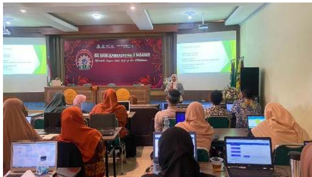
Gambar 1. Pelatihan akuntansi untuk AUM