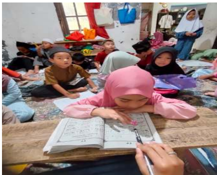
Gambar 1. Kegiatan Membaca Iqro