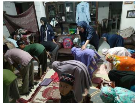
Gambar 2. Kegiatan Praktik Gerakan Sholat