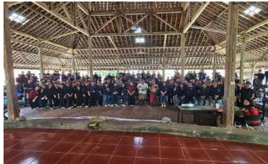
Gambar 1. Foto Bersama di Wantilan Desa Adat Tenganan Pegriingsingan

Bentuk kearifan lokal adalah pengetahuan, nilai, norma, dan praktik yang berkembang secara turun-temurun dalam suatu komunitas dan berfungsi sebagai pedoman dalam mengelola sumber daya alam dan lingkungan hidup. Dalam konteks hukum lingkungan, kearifan lokal berperan sebagai dasar pembentukan aturan adat yang mengatur interaksi manusia dengan alam, sehingga tercipta keseimbangan dan keberlanjutan ekosistem. Desa Tenganan, sebagai salah satu desa adat di Bali yang masih memegang teguh tradisi dan adat istiadatnya, memiliki bentuk-bentuk kearifan lokal yang sangat kuat dan terstruktur, terutama dalam pengelolaan lingkungan hidup. Kearifan ini tidak hanya menjadi pedoman sosial, tetapi juga berfungsi sebagai hukum adat yang mengikat masyarakatnya.