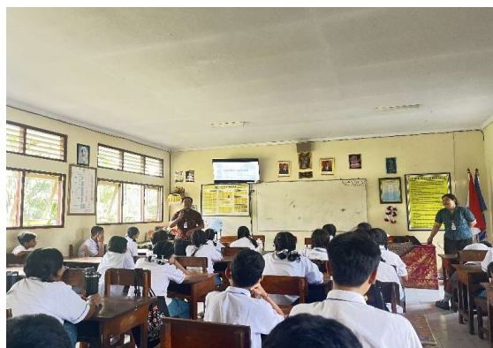
Gambar 2. Narasumber sedang berdiskusi atau Tanya jawab dengan peserta

Kegiatan diskusi menjadi salah satu bagian yang paling efektif dalam menggali pemikiran siswa. Mereka tampak aktif berdiskusi membahas berbagai permasalahan sosial yang relevan dengan tema nasionalisme, seperti kurangnya rasa toleransi, pergaulan bebas, dan pengaruh budaya asing melalui media sosial. Beberapa siswa berhasil mengemukakan solusi atas permasalahan tersebut dengan cara-cara yang sederhana namun konkret, seperti saling mengingatkan dalam pergaulan, menyaring informasi sebelum membagikannya, serta tetap menjaga identitas budaya lokal. Hal ini menunjukkan bahwa siswa mampu memahami nilai-nilai kebangsaan secara lebih kontekstual dan tidak terbatas pada hafalan definisi semata (Santika & Konda, 2023).