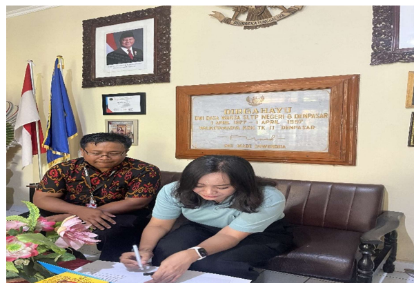
Gambar 4. Penandatanganan kerjasama antara Prodi PPKn Undwi dengan SMP Negeri 8 Denpasar

Pihak sekolah juga memberikan tanggapan yang sangat baik terhadap pelatihan ini. Guru pendamping menyatakan, bahwa pendekatan yang digunakan sangat cocok untuk siswa usia SMP, karena tidak hanya menyampaikan teori, tetapi juga melibatkan siswa secara aktif dalam diskusi dan praktik langsung. Mereka menilai bahwa kegiatan ini mampu menumbuhkan minat siswa terhadap isu kebangsaan, sekaligus menjadi momen yang tepat untuk memperkuat pendidikan karakter di sekolah. Bahkan, sekolah menyatakan kesiapannya untuk mendukung pelaksanaan kegiatan serupa secara berkala, agar nilai-nilai yang telah ditanamkan dapat terus dikembangkan. Untuk memperkuat pelaksanaan kegiatan ini dimasa depan, antara Prodi PPKn dan SMP Negeri 8 Denpasar membangun kerjasama.