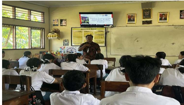
Gambar 1. Pemaparan materi pengabdian oleh narasumber

Kegiatan pelatihan penanaman nilai nasionalisme dan bela negara yang dilaksanakan di SMP Negeri 8 Denpasar menunjukkan dampak yang positif terhadap peserta didik. Hasil ini diperoleh dari pengamatan langsung selama pelaksanaan kegiatan, baik melalui keterlibatan siswa dalam setiap sesi, respons terhadap materi yang disampaikan, serta interaksi selama diskusi dan simulasi berlangsung. Secara umum, siswa menunjukkan minat yang tinggi, rasa ingin tahu yang besar, dan sikap terbuka terhadap topik-topik kebangsaan yang diangkat dalam pelatihan.