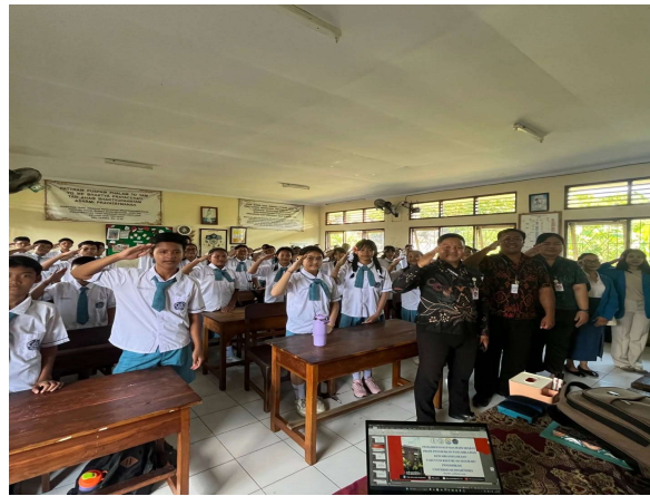
Gambar 3 Sesi foto bersama antara team pengabdian dan peserta

Sesi refleksi yang dilakukan di akhir pelatihan juga memberikan gambaran yang jelas mengenai pemahaman dan kesan siswa terhadap kegiatan ini. Mereka menuliskan berbagai bentuk komitmen pribadi, mulai dari hal kecil seperti tidak membuang sampah sembarangan, lebih rajin belajar, hingga niat untuk menjadi pelajar yang membawa pengaruh positif di sekolah. Meskipun terkesan sederhana, komitmen-komitmen ini mencerminkan proses internalisasi nilai-nilai yang telah ditanamkan selama kegiatan berlangsung (Santika et al, 2022). Siswa menunjukkan kesadaran bahwa nasionalisme tidak harus diwujudkan dalam tindakan besar, melainkan dimulai dari kebiasaan dan sikap sehari-hari yang positif. Kegiatan ini ditutup dengan foto bersama antar team dengan peserta.