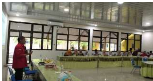
Gambar 6. Pemaparan Materi Terkait Prinsip-Prinsip Pendidikan Karakter Berbasis Kearifan Lokal

Pendidikan karakter tidak hanya bersifat normatif atau teoritis, tetapi harus mampu menyentuh ranah pengalaman nyata siswa, sehingga nilai-nilai seperti gotong royong, tanggung jawab, disiplin, kepedulian sosial, dan integritas dapat benar-benar diinternalisasikan dalam kehidupan sehari-hari. Pendekatan pendidikan karakter yang berlandaskan kearifan lokal memiliki keunggulan dalam menumbuhkan rasa identitas, solidaritas, dan tanggung jawab sosial di kalangan generasi muda, karena nilai-nilai ini telah melekat dalam praktik budaya komunitas setempat (Yunus, 2013).