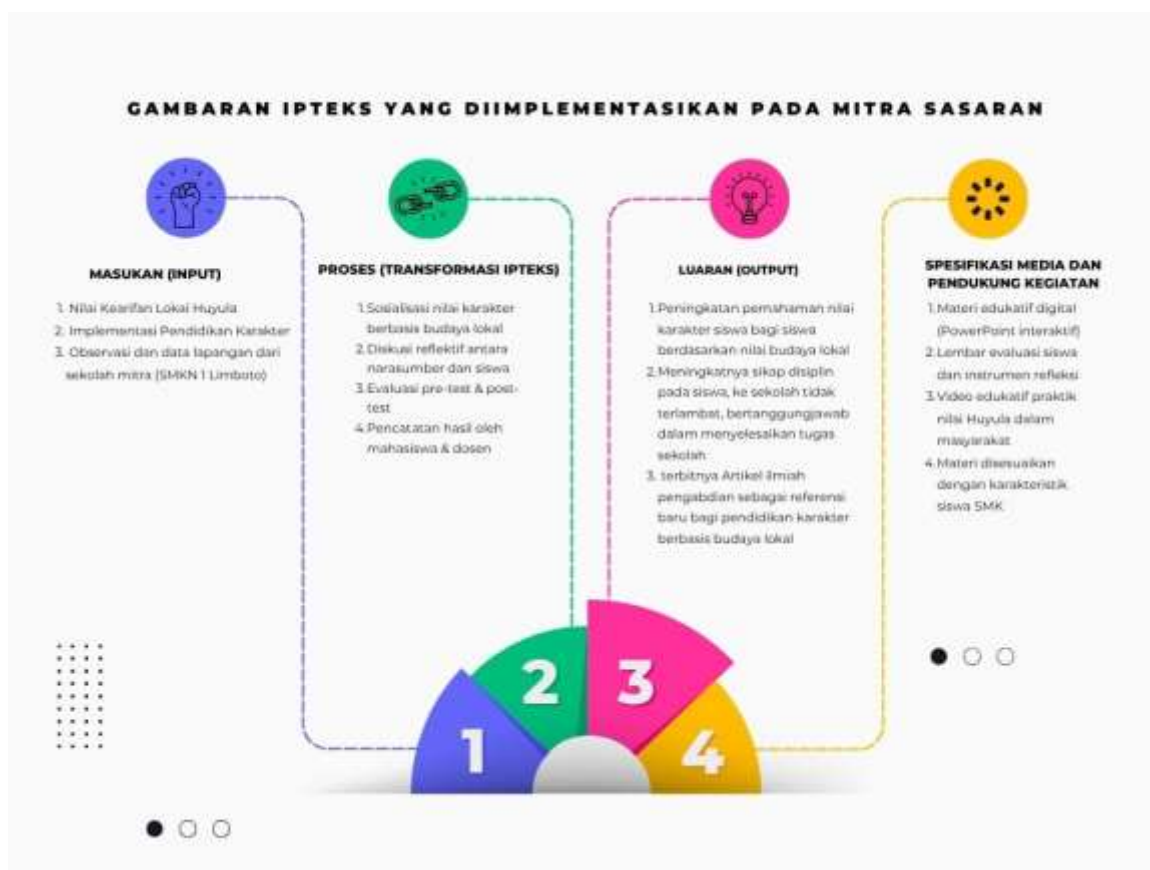
Gambar 3. Skema implementasi IPTEKS dalam Implementasi Pendidikan Karakter Melalui Penguatan Nilai Huyula Di SMK Negeri 1 Limboto

Skema implementasi IPTEKS dalam pengabdian ini dapat di lihat pada gambar berikut :