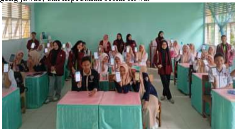
Gambar 2. Dokumentasi Saat Observasi Awal Tingkat Pemahaman Siswa Terkait Nilai Huyula

Dengan demikian, pola persepsi moderat mayoritas siswa menunjukkan perlunya strategi penguatan pendidikan karakter yang lebih intensif dan inovatif, yang mengintegrasikan praktik nyata, pengalaman sosial, serta pembelajaran reflektif. Berdasarkan data observasi ini, pengabdian kolaborasi antara dosen dan mahasiswa Program Studi S1 PPKn FIS UNG menjadi langkah penting untuk memastikan nilai Huyula benar-benar dapat menjadi landasan dalam pembentukan karakter kebersamaan, tanggung jawab, dan kepedulian sosial siswa.