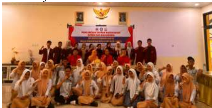
Gambar 8. Sesi Foto Bersama Sebagai Komitmen Keberlanjutan Program

Dengan kombinasi semua aspek tersebut kesadaran akademik, inklusivitas sosial, pembelajaran berbasis pengalaman nyata, partisipasi kolektif, dan penguatan sistematis pendidikan karakter melalui nilai Huyula berhasil diterapkan secara efektif. Siswa tidak hanya memahami konsepnya secara normatif, tetapi juga mampu menginternalisasi dan mengamalkan nilai-nilai Huyula dalam berbagai aspek kehidupan mereka, sehingga karakter kebersamaan, tanggung jawab, dan kepedulian sosial tumbuh secara nyata dan berkelanjutan.