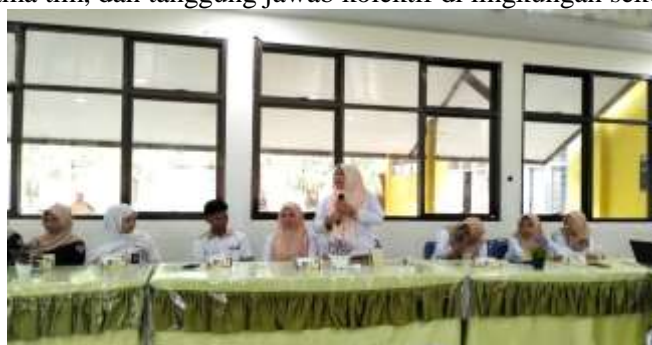
Gambar 7. Potret Siswa bertanya Secara Mendalam Terkait Pendidikan Karakter berbasis Nilai Kearifan Lokal Huyula

Metode yang diterapkan pada sosialisasi ini bersifat interaktif, memungkinkan siswa untuk tidak hanya menjadi pendengar pasif, tetapi juga peserta aktif. Siswa diberikan kesempatan untuk berbagi pengalaman pribadi, menyampaikan pertanyaan kritis, serta mendiskusikan bagaimana nilai Huyula dapat diterapkan dalam situasi nyata, baik dalam ranah akademik maupun kehidupan sosial di sekolah. Kegiatan ini juga menggunakan simulasi situasi dan studi kasus, sehingga peserta dapat memahami implikasi praktis dari penguatan karakter berbasis nilai lokal. Hasil dari interaksi ini menunjukkan bahwa metode partisipatif terbukti meningkatkan pemahaman siswa secara kontekstual, serta menumbuhkan motivasi untuk mengamalkan nilai Huyula secara konsisten. Selain itu, sosialisasi ini menekankan pentingnya kontinuitas dan penguatan nilai-nilai karakter. Pembelajaran karakter yang efektif membutuhkan integrasi antara teori, praktik, dan refleksi, sehingga peserta didik mampu mengevaluasi perilaku mereka sendiri, mengidentifikasi potensi positif yang dimiliki, serta memperbaiki aspek-aspek yang perlu dikembangkan (Wantu et al., 2025). Dengan demikian, pendidikan karakter melalui penguatan nilai Huyula tidak hanya berdampak pada prestasi akademik, tetapi juga pada kualitas interaksi sosial, kerjasama tim, dan tanggung jawab kolektif di lingkungan sekolah.