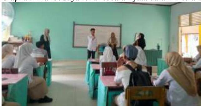
Gambar 5. Dokumentasi Saat Mahasiswa Memberikan Penguatan-Penguatan Terkait Implementasi Nilai-Nilai Huyula Sebagai Fondasi Pendidikan Karakter Kepada Siswa/i SMKN 1 Limboto.

Hal ini sejalan dengan argumentasi (Suwarni & Makruf, 2023) yang menekankan bahwa pendidikan karakter tidak cukup hanya disampaikan melalui teori, tetapi harus melalui praktik habituasi atau pembiasaan dalam kehidupan nyata sehingga membentuk kebiasaan dan karakter. Selain itu, menurut (Trihandayani, 2025) pengembangan karakter efektif bila melibatkan pengalaman langsung yang memungkinkan peserta didik mengalami, mempraktikkan, dan merefleksikan nilai-nilai moral dalam konteks sosialnya. Dengan demikian, penguatan nilai Huyula melalui aktivitas mingguan yang interaktif ini bertujuan membangun internalisasi karakter yang lebih mendalam, sekaligus memfasilitasi peserta didik dalam menerapkan nilai budaya lokal secara nyata dalam interaksi sosial di sekolah.