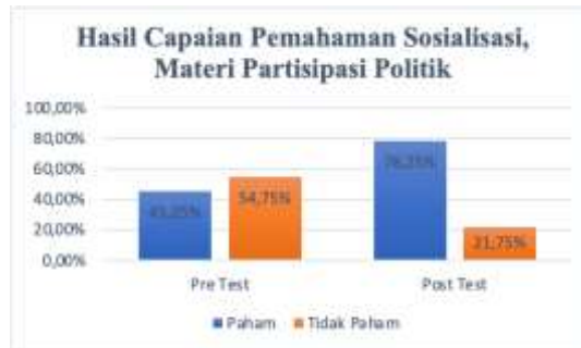
Gambar 3. Perbandingan Nilai Pra Test dan Post Test (Partisipasi Politik Masyarakat)

Sementara itu, untuk tolok ukur keberhasilan pelaksanaan kegiatan pengabdian kepada masyarakat dalam tema pembahasan tentang partisipasi politik, kami memberikan angket pre test dan post test sebagaimana ditampilkan pada tabel di bawah ini: