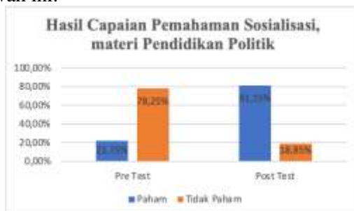
Gambar 2. Perbandingan Nilai Pra Test dan Post Test (Pendidikan Politik Masyarakat)

Untuk tolok ukur keberhasilan pelaksanaan kegiatan pengabdian kepada masyarakat ini, kami memberikan angket pre test dan post test terhadap materi atau tema yang disajikan sebagaimana ditampilkan pada tabel di bawah ini: