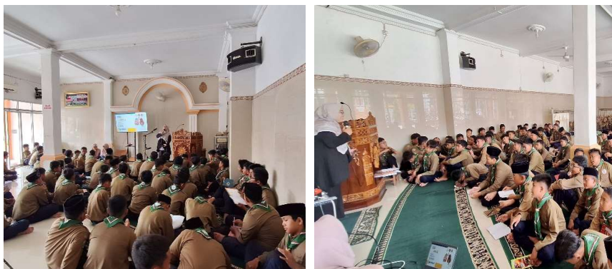
Gambar 2. Kegiatan Edukasi “Tanpa Rokok itu Keren”

Kegiatan edukasi “Tanpa Rokok itu Keren” dilaksanakan di SMP Muhammadiyah Adiwerna Kabupaten Tegal dan diikuti oleh siswa kelas VII dan VIII dengan total peserta sebanyak 127 orang. Sebelum pelaksanaan kegiatan, dilakukan pre-test untuk mengukur tingkat pengetahuan awal siswa mengenai bahaya rokok.