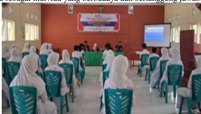
Gambar 2. Membangun Kesadaran Multikultural Bagi Siswa SMKN 5 Gorontalo.

Pengenalan nilai-nilai multikultural di SMKN 5 Gorontalo bertujuan untuk menumbuhkan pemahaman siswa mengenai signifikansi keragaman budaya sebagai pedoman etika dan moral. Nilai-nilai multikultural, yang mencakup prinsip seperti toleransi dan penghargaan terhadap perbedaan, dianggap sebagai elemen penting yang mencerminkan identitas keberagaman yang harus dijunjung oleh siswa. Melalui tahapan pengenalan ini, para siswa didorong untuk tidak hanya mengenali pentingnya nilai-nilai itu, tetapi juga untuk menjadikannya bagian dari kehidupan mereka sehari-hari, baik di lingkungan sekolah maupun di masyarakat. Nilai-nilai yang bersifat multikultural disampaikan melalui berbagai pendekatan, termasuk pembelajaran langsung, diskusi dalam kelompok, dan kegiatan ekstrakurikuler yang relevan dengan tema keragaman budaya. Selain itu, siswa dikenalkan pada konteks sejarah dan filsafat dari nilai-nilai tersebut, sehingga mereka dapat melihatnya bukan sekadar ide, tetapi juga sebagai prinsip etis yang masih relevan pada saat ini. Proses orientasi ini disusun untuk membangun kesadaran serta komitmen siswa terhadap nilai-nilai multikultural, yang pada akhirnya akan memperkuat sikap toleransi mereka sebagai individu yang berbudaya dan bertanggung jawab.