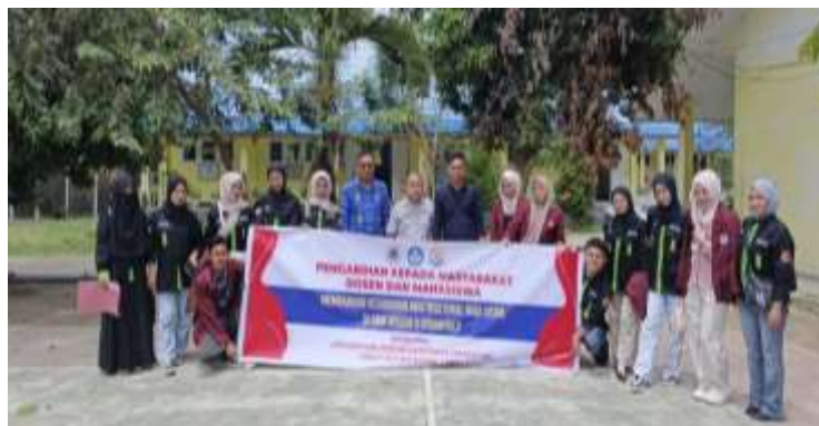
Gambar 5. Sesi Foto Bersama Tim Dosen, Mahasiswa Prodi PPKn FIS UNG, dan Guru SMK Negeri 5 Gorontalo sebagai Simbol Keberlanjutan Program Penguatan Kesadaran Multikultural

Kegiatan monitoring akan difokuskan pada penerapan nilai-nilai multikultural seperti toleransi, gotong royong, serta penghargaan terhadap keberagaman dalam aktivitas keseharian siswa baik di sekolah maupun di luar lingkungan belajar formal. Dengan demikian, program ini tidak berhenti pada tahap pelatihan dan sosialisasi, melainkan berlanjut sebagai upaya pembinaan karakter dan sikap sosial secara berkesinambungan. Sesi foto bersama menjadi simbol kolaborasi antargenerasi antara civitas akademika Prodi S1 PPKn FIS UNG dan Sekolah sebagai Mitra, sekaligus pengingat visual akan pentingnya menjaga semangat kebersamaan dalam keberagaman. Lebih jauh, kegiatan ini mempertegas bahwa kerja sama antara perguruan tinggi dan sekolah menengah bukan hanya sarana transfer pengetahuan, tetapi juga wahana pembentukan karakter kebangsaan yang berakar pada nilai kemanusiaan yang menjadi landasan moral di tengah masyarakat multikultural.