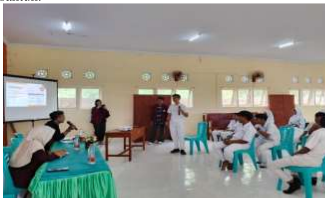
Gambar 3. Penguatan Praktis Membangun Kesadaran Multikultural Pada Siswa/i SMKN 5 Gorontalo

Pelaksanaan penguatan kesadaran multikultural di SMK Negeri 5 Gorontalo dilakukan melalui berbagai langkah praktis yang menyatu dengan aktivitas siswa sehari-hari di lingkungan sekolah. Setiap guru dan tenaga pendidik berupaya membiasakan peserta didik untuk bersikap toleran, saling menghargai, dan tidak membeda-bedakan teman berdasarkan latar belakang budaya, suku, maupun agama. Pembiasaan ini ditanamkan dalam bentuk aturan kelas sederhana, sikap saling menghormati, serta komunikasi yang santun.