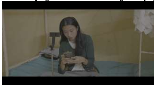
Gambar 4. Lani menerima chat dari orang misterius

soory ya kalau dibangunan ituaku tidak berani,lagian cuma 10 jt itu ternyata terlalu sikit,kalau aku challengenya di gedung itu, dan resikoanya gedek,kamu cari orang lain aja ya.