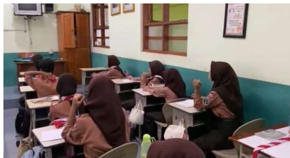
Gambar 2. Partisipasi Aktif Siswa Siklus 1

Berdasarkan hasil observasi oleh dua observer, partisipasi siswa pada aspek fisik tergolong cukup aktif. Sebagian besar siswa terlihat turut serta dalam mengikuti tugas pembelajaran secara mandiri, dengan beberapa siswa mulai menunjukkan kepekaan terhadap keberagaman budaya, misalnya dengan menyebutkan budaya daerah asalnya ketika berdiskusi mengenai simbol-simbol budaya.