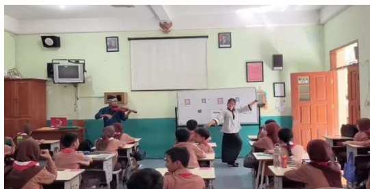
Gambar 4. Pertunjukan Sederhana Guru Model bersama Observer Siklus 2

Sebelum penampilan dimulai, peserta didik diarahkan untuk mendengarkan lagu yang dimainkan dan memperhatikan gerakan tari dengan saksama karena akan ada sesi tanya jawab setelahnya. Strategi ini berhasil membangun rasa penasaran dan antusiasme siswa sejak awal pembelajaran. Setelah pertunjukan, guru model memberikan beberapa pertanyaan yang berkaitan dengan judul, asal daerah, dan makna lagu yang dimainkan. Peserta didik yang dapat menjawab dengan benar diberi reward sederhana sebagai bentuk apresiasi dan motivasi.