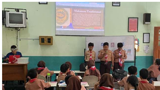
Gambar 5. Partisipasi Aktif Siswa Siklus 2

Pada aspek fisik, terdapat peningkatan partisipasi aktif secara menyeluruh. Siswa terlihat lebih berani bertanya kepada guru dan sesama teman kelompok ketika mengalami kesulitan, baik dalam memahami referensi budaya maupun dalam menerapkan ide ke dalam desain logo. Aktivitas komunikasi antar-anggota kelompok berlangsung lebih hidup dan saling menghargai perbedaan pandangan.