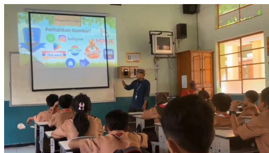
Gambar 1. Pembelajaran Siklus 1 oleh Guru Model

Pelaksanaan pembelajaran pada siklus 1 yang dilakukan di hari Jum'at, tanggal 11 April 2025 difokuskan pada penggalian pemahaman awal dan latar belakang budaya siswa sebagai bagian dari asesmen diagnostik, serta pengenalan materi Logo Budaya Nusantara dengan menggunakan model pembelajaran Discovery Learning . Kegiatan diawali dengan sapaan dan penyampaian tujuan pembelajaran oleh guru model. Guru menekankan bahwa siswa akan belajar mengenali unsur-unsur budaya dalam logo, dan bagaimana simbol-simbol tersebut merepresentasikan kekayaan budaya Indonesia.