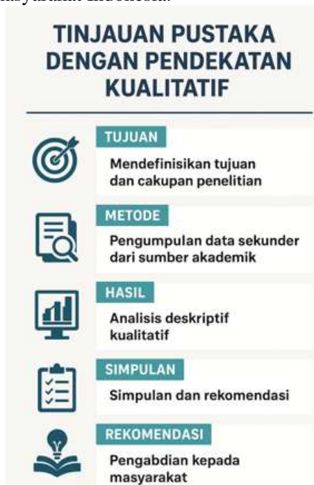
Gambar 1. Diagram Alur Penelitian

pengembangan model pengabdian masyarakat yang inovatif, adaptif, dan berorientasi pada keberlanjutan sosial-ekonomi masyarakat Indonesia.