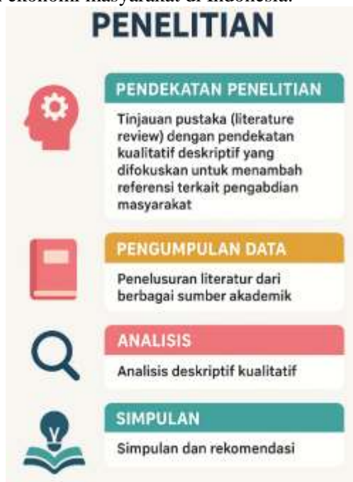
Gambar 1. Diagram Alur Penelitian

Penelitian ini diharapkan mampu menambah referensi dan memperkaya literatur akademik terkait pengabdian masyarakat dalam konteks pendidikan berkelanjutan. Melalui analisis deskriptif yang sistematis terhadap 32 artikel terpilih, penelitian ini berupaya mengidentifikasi praktik terbaik ( best practices ), model kolaboratif, serta pendekatan inovatif yang telah terbukti efektif dalam meningkatkan literasi ekonomi keluarga dan kesejahteraan sosial. Dengan demikian, hasil penelitian ini dapat menjadi rujukan konseptual dan praktis bagi lembaga pendidikan, akademisi, maupun pemangku kebijakan dalam merancang program pengabdian masyarakat yang lebih relevan, berkelanjutan, dan berdampak nyata terhadap pemberdayaan ekonomi masyarakat di Indonesia.