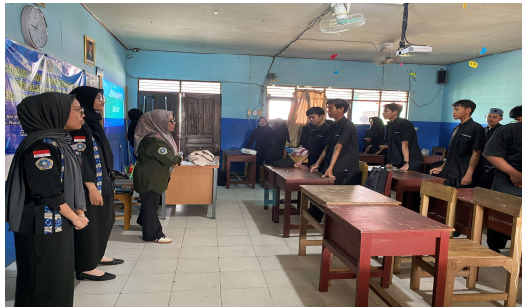
Gambar 1. Perkenalan Tim Pengabdian

Sesi I – Sosialisasi dan Pre-Test. Pada sesi awal, tim pengabdian memperkenalkan diri kepada peserta serta menjelaskan tujuan kegiatan, yaitu menumbuhkan kesadaran pentingnya disiplin dalam mengelola waktu secara efektif, terutama bangun pagi dan menjalankan rutinitas harian dengan lebih terstruktur. Lihat gambar 1