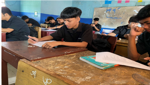
Gambar 2. Pre-test

Setelah penjelasan awal, peserta diberikan pre-test untuk mengukur tingkat kemampuan mereka dalam disiplin dalam mengelola waktu secara efektif sebelum pelatihan dimulai. Pre-test ini bertujuan untuk mengetahui sejauh mana siswa memahami pentingnya disiplin waktu dalam kehidupan sehari-hari. Lihat gambar 2