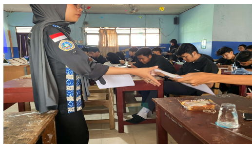
Gambar 4. Pos-test

Kegiatan diakhiri dengan Postest untuk mengetahui peningkatan pemahaman siswa setelah mengikuti pelatihan. Lihat gambar 4