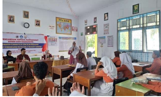
Gambar 1. Dokumentas penguayani literasi politik sejak dini di SMA Negeri 5 Gorontalo.

Urgensi literasi politik sejak dini semakin penting di era digital, di mana siswa dihadapkan pada arus informasi dari media sosial. Tanpa kemampuan literasi yang memadai, mereka rentan terpengaruh hoaks, ujaran kebencian, dan propaganda yang dapat merusak pola pikir kritis. Oleh karena itu, kegiatan ini menekankan kemampuan siswa untuk memilah informasi politik, membedakan fakta dan opini, serta menilai kebenaran informasi sebelum menyebarkannya. Pendekatan ini tidak hanya membangun ketahanan individu, tetapi juga memperkuat kualitas demokrasi secara kolektif. Keberhasilan literasi politik dapat terlihat dari perubahan sikap siswa. Mereka menjadi lebih aktif mengajukan pertanyaan, lebih kritis menanggapi isu yang muncul, dan lebih berani menyampaikan pendapat dengan santun. Siswa juga menunjukkan sikap menghormati perbedaan, tidak memaksakan kehendak, dan mencari solusi melalui musyawarah. Perubahan ini menandakan bahwa literasi politik mampu menanamkan nilai-nilai demokrasi dalam perilaku sehari-hari, termasuk kebiasaan bermusyawarah, menghargai pendapat orang lain, dan bersikap terbuka.