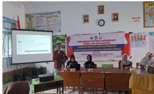
Gambar 3. Dokumentasi mahasiswa UNG mendampingi siswa dalam diskusi multikultural di sekolah.

Kegiatan dilanjutkan dengan diskusi interaktif yang memberi siswa kesempatan berbagi pengalaman dalam menghadapi perbedaan. Beberapa siswa menceritakan bagaimana mereka menanggapi teman dengan pandangan atau agama berbeda dalam kegiatan kelompok. Diskusi dipandu agar siswa mengaitkan pengalaman tersebut dengan prinsip musyawarah, toleransi, dan tanggung jawab sosial. Narasumber menekankan bahwa praktik demokrasi di sekolah dimulai dari hal-hal sederhana, seperti mendengarkan pendapat orang lain dan mengambil keputusan bersama. Mahasiswa UNG berperan sebagai fasilitator pendamping, memandu kelompok kecil, mengadakan simulasi musyawarah, dan permainan peran untuk memperlihatkan cara mengelola perbedaan secara adil. Kehadiran mahasiswa membuat suasana belajar lebih santai dan akrab, sehingga siswa lebih nyaman menyampaikan pandangan mereka. Strategi ini mengubah pembelajaran menjadi pengalaman langsung, sehingga siswa memahami bahwa multikulturalisme bukanlah konsep abstrak, melainkan bagian nyata dari kehidupan sehari-hari yang membutuhkan sikap terbuka dan empati.