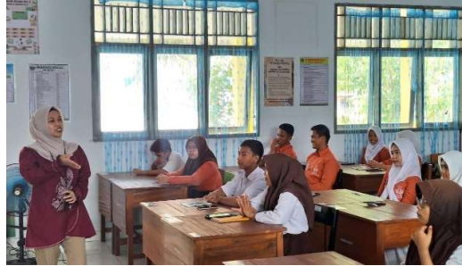
Gambar2. Dokumentasi penyampaian materi multikultural oleh dosen dalam kegiatan pengabdian di SMA Negeri 5 Gorontalo.

Kegiatan dilanjutkan dengan diskusi interaktif yang memberi siswa kesempatan berbagi pengalaman dalam menghadapi perbedaan. Beberapa siswa menceritakan bagaimana mereka menanggapi teman dengan pandangan atau agama berbeda dalam kegiatan kelompok. Diskusi dipandu agar siswa mengaitkan pengalaman tersebut dengan prinsip musyawarah, toleransi, dan tanggung jawab sosial. Narasumber menekankan bahwa praktik demokrasi di sekolah dimulai dari hal-hal sederhana, seperti mendengarkan pendapat orang lain dan mengambil keputusan bersama. Mahasiswa UNG berperan sebagai fasilitator pendamping, memandu kelompok kecil, mengadakan simulasi musyawarah, dan permainan peran untuk memperlihatkan cara mengelola perbedaan secara adil. Kehadiran mahasiswa membuat suasana belajar lebih santai dan akrab, sehingga siswa lebih nyaman menyampaikan pandangan mereka. Strategi ini mengubah pembelajaran menjadi pengalaman langsung, sehingga siswa memahami bahwa multikulturalisme bukanlah konsep abstrak, melainkan bagian nyata dari kehidupan sehari-hari yang membutuhkan sikap terbuka dan empati.