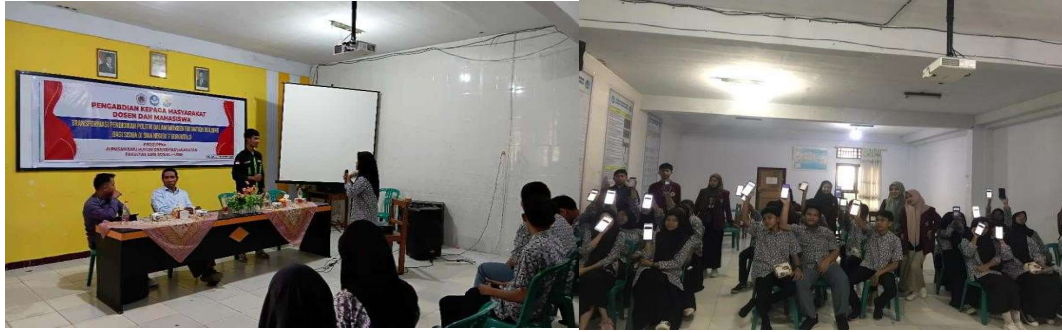
Gambar 3. Diskusi dan Evaluasi melalui Pembagian Kuesioner Pendidikan Politik dalam Membentuk Nation building di SMA Negeri 7 Gorontalo.

Gambar 3 memperlihatkan suasana kegiatan diskusi dan evaluasi yang dilakukan di aula SMA Negeri 7 Gorontalo sebagai bagian dari pelaksanaan pengabdian masyarakat. Dalam kegiatan ini, tim pengabdian yang terdiri atas dosen dan mahasiswa S1 Program Studi Pendidikan Pancasila dan Kewarganegaraan (PPKn) Fakultas Ilmu Sosial Universitas Negeri Gorontalo memfasilitasi sesi tanya jawab serta pembagian kuesioner kepada siswa peserta. Sesi tersebut bertujuan untuk mengetahui tingkat pemahaman dan respon siswa terhadap materi pendidikan politik yang telah disampaikan sebelumnya. Terlihat dalam gambar bahwa kegiatan berlangsung secara interaktif; beberapa siswa aktif mengajukan pertanyaan dan berdiskusi dengan pemateri di depan ruangan, sementara yang lain mengikuti dengan antusias. Suasana kegiatan menunjukkan adanya keterlibatan langsung antara pemateri dan peserta, mencerminkan penerapan metode partisipatif dan edukatif dalam proses penguatan literasi politik di lingkungan sekolah. Kegiatan ini juga menandai tahap akhir dari pelaksanaan pengabdian sebelum dilakukan analisis hasil evaluasi terhadap capaian pembelajaran politik siswa. Berdasarkan dua indikator kegiatan yang dilaksanakan di SMA Negeri 7 Gorontalo, tema pengabdian mengenai pendidikan politik dalam membentuk nation building menghasilkan capaian yang dapat dilihat pada grafik dibawah ini;