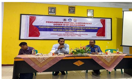
Gambar 1. Pengenalan Pendidikan Politik dalam Membentuk Nation building bagi Siswa SMA Negeri 7 Gorontalo