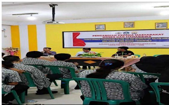
Gambar 2. Penguatan Pendidikan Politik dalam Membentuk Nation Building

Dalam kegiatan pengabdian ini, terdapat anggota tim yang bertugas memberikan penguatan materi kepada siswa. Pendidikan politik dipahami sebagai proses pembelajaran yang bertujuan menumbuhkan pengetahuan, kesadaran, serta sikap kritis warga negara dalam memahami kehidupan politik. Bagi generasi muda, khususnya siswa SMA, pendidikan politik bukan hanya tentang mengenal teori atau struktur pemerintahan, melainkan tentang bagaimana mereka memahami hak dan kewajiban sebagai warga negara, menanamkan nilai-nilai demokrasi, serta mengembangkan rasa tanggung jawab sosial dalam kehidupan sehari-hari. Penguatan pendidikan politik menjadi penting karena melalui kegiatan ini generasi muda disiapkan menjadi warga negara yang melek politik dan memiliki literasi politik yang baik. Siswa diharapkan mampu berpartisipasi secara aktif dalam kehidupan berbangsa sekaligus menghindari sikap apatis terhadap politik yang masih sering ditemukan di kalangan pemilih pemula. Tujuan akhirnya adalah membentuk generasi yang cerdas, kritis, dan berkarakter.