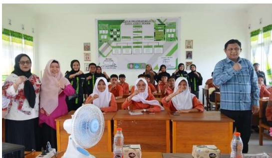
Gambar 1. Pengenalan Implementasi Pendidikan Politik

Aspek kedua adalah pendidikan politik dan demokrasi bagi generasi muda. Bagian ini menekankan pentingnya menanamkan nilai-nilai demokrasi, seperti keterbukaan, musyawarah, toleransi, serta sikap menghargai perbedaan. Siswa dilatih berpartisipasi dalam pengambilan keputusan melalui wadah organisasi kesiswaan, seperti OSIS, MPK, dan ekstrakurikuler lainnya. Dengan cara ini, mereka bukan hanya memahami konsep demokrasi secara teoritis, tetapi juga menginternalisasikannya dalam praktik sehari-hari. Hal ini bertujuan agar siswa tumbuh menjadi pribadi yang kritis, mampu berpikir rasional, serta siap menjadi agen perubahan di tengah masyarakat. Secara keseluruhan, kedua aspek ini saling mendukung dalam menciptakan lingkungan belajar yang mendorong siswa aktif, kritis, dan demokratis. Melalui kegiatan ekstrakurikuler, pendidikan politik di SMAN 6 Gorontalo diharapkan membentuk generasi muda yang sadar akan perannya sebagai warga negara, memiliki kepedulian sosial, serta mampu berkontribusi positif dalam pembangunan bangsa.