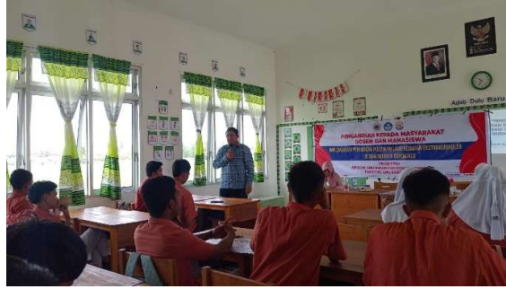
Gambar 3. Penguatan Praktis Pendidikan Politik dan Demokrasi bagi Generasi Muda

Gambar 3 memperlihatkan penguatan praktis pendidikan politik dan demokrasi bagi generasi muda. Implementasi ini menekankan tiga aspek utama: diskusi, refleksi pengalaman, dan potret implementasi. Tujuan dari ketiga aspek ini adalah memperkuat pemahaman siswa tentang nilai demokrasi serta penerapannya dalam kehidupan sehari-hari. Diskusi menjadi langkah awal yang penting. Siswa dibagi ke dalam kelompok kecil untuk membahas isu politik dan prinsip demokrasi yang relevan dengan kehidupan mereka. Dalam sesi ini, setiap siswa diberi kesempatan menyampaikan pandangan, pengalaman, dan pendapat pribadi terkait partisipasi politik dan pengambilan keputusan. Diskusi tidak hanya menambah wawasan siswa, tetapi juga mendorong kemampuan berpikir kritis, komunikasi, dan kolaborasi. Dengan bimbingan fasilitator, siswa merumuskan ide dan strategi untuk mengimplementasikan nilai demokrasi melalui kegiatan ekstrakurikuler maupun interaksi sosial di sekolah. Setelah sesi diskusi, dilakukan kegiatan refleksi pengalaman. Siswa diminta menceritakan pengalaman pribadi yang berkaitan dengan praktik demokrasi dan partisipasi politik, termasuk keterlibatan mereka dalam organisasi dan musyawarah. Proses ini mendorong siswa berpikir mendalam tentang bagaimana pengalaman tersebut membentuk sikap, perilaku, dan kemampuan mereka untuk berpartisipasi aktif di komunitas. Bimbingan fasilitator sangat penting agar siswa dapat mengidentifikasi nilai-nilai demokrasi yang muncul dari pengalaman mereka.