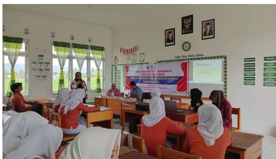
Gambar 2. Penguatan Pendidikan Politik

Gambar 1 menunjukkan pengenalan implementasi pendidikan politik di SMAN 6 Gorontalo. Tujuannya adalah membangun kesadaran siswa tentang pentingnya pemahaman politik sejak dini sebagai dasar pembentukan warga negara yang cerdas, kritis, dan bertanggung jawab. Pendidikan politik dipandang sebagai fondasi pembentukan kepribadian siswa yang tidak hanya unggul secara akademik, tetapi juga memiliki kepedulian sosial, rasa tanggung jawab, dan kemampuan berpartisipasi aktif dalam kehidupan berbangsa dan bernegara. Implementasi ini dilakukan secara berkelanjutan melalui praktik, diskusi, dan musyawarah dalam kegiatan non-akademik (Sobri & Umar, 2022). Upaya ini dilakukan melalui berbagai strategi pembelajaran yang dikaitkan dengan kegiatan ekstrakurikuler, seperti OSIS, MPK, Pramuka, serta organisasi lain yang menjadi sarana strategis untuk menanamkan nilai partisipasi, tanggung jawab, kepemimpinan, dan membentuk karakter demokratis siswa (Sitanggang, 2020). Melalui ruang-ruang ini, siswa berlatih menyampaikan pendapat, terlibat dalam musyawarah, belajar menghargai perbedaan, dan mengambil keputusan secara kolektif.