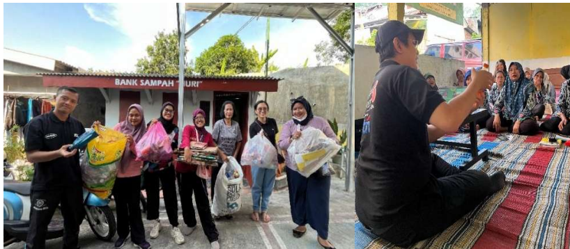
Gambar 2. Pendampingan Pengelolaan Bank Sampah Nuri Desa Kandri Gunungpati

Penelitian Halid et al. (2022) di NTB menunjukkan bahwa bank sampah tidak hanya berkontribusi pada pengurangan sampah, tetapi juga berperan dalam pemberdayaan ekonomi masyarakat melalui usaha mikro berbasis daur ulang. Fenomena serupa mulai terlihat di Desa Kandri, meskipun skala ekonominya masih terbatas.