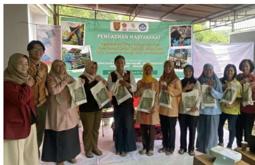
Gambar 1. Kegiatan Sosialisasi Green Village Desa Kandri

Peningkatan ini sejalan dengan penelitian Ardani et al. (2025), yang menemukan bahwa komunikasi lingkungan berbasis partisipasi masyarakat dapat meningkatkan pengetahuan dan kepedulian hingga lebih dari dua kali lipat dalam konteks bank sampah di Lampung. Hal ini menunjukkan bahwa keberhasilan sosialisasi di Desa Kandri tidak hanya terletak pada transfer informasi, tetapi juga pada penciptaan ruang dialog yang memungkinkan warga mengidentifikasi masalah dan solusi secara kolektif.