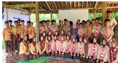
Gambar 4. Peserta Pelatihan