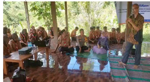
Gambar 2. Pemberian Materi Pelatihan