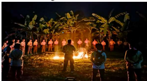
Gambar 3. Pentas Seni Pada Acara Api Unggun