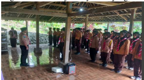
Gambar 1. Acara Dibuka Oleh Bpk Camat Peterongan Selaku Ka.Mabiran

Puncak kegiatan adalah pembentukan Kader Sadar Hukum Pramuka, yaitu kelompok perintis yang berperan sebagai agen perubahan dan duta hukum di lingkungan sekolah dan masyarakat. Kader ini dipilih berdasarkan kriteria kedisiplinan, kepemimpinan, kepedulian sosial, dan kemampuan komunikasi. Keberadaan mereka sangat penting sebagai upaya berkelanjutan dalam menanamkan nilai-nilai kesadaran hukum di kalangan remaja. Kader Pramuka Sadar Hukum berfungsi tidak hanya sebagai penyebar informasi hukum, tetapi juga sebagai teladan dalam menegakkan kedisiplinan dan kepatuhan terhadap aturan. Dengan pemahaman hukum yang baik, mereka mampu menumbuhkan budaya hukum positif di lingkungan sekitarnya, memperkuat karakter bangsa yang bermartabat, serta menjadi pelopor ketertiban sosial. Sinergi antara Pramuka, Perguruan Tinggi, dan Kepolisian dalam kegiatan ini telah membuktikan bahwa pembinaan hukum berbasis karakter dan partisipasi remaja dapat menjadi strategi efektif dalam membangun generasi muda yang cerdas hukum, berintegritas, dan siap menghadapi tantangan zaman menuju masyarakat yang berkeadilan, tertib, dan bermartabat.