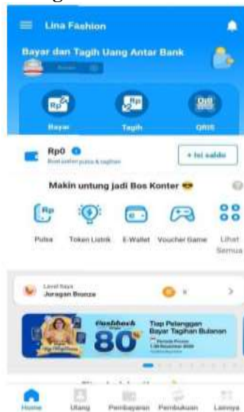
Gambar 4. Tampilan Utama Aplikasi Buku Warung