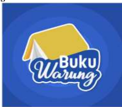
Gambar 1. Aplikasi Buku Warung