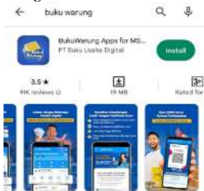
Gambar 2. Aplikasi Buku Warung