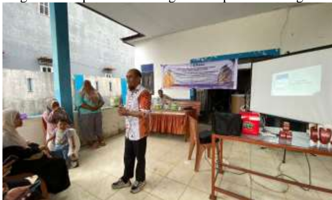
Gambar 2. Dokumentasi Sesi Pelatihan Praktik Langsung Aplikasi Buku Warung di Kantor BUMDesa Mattiro Ulung