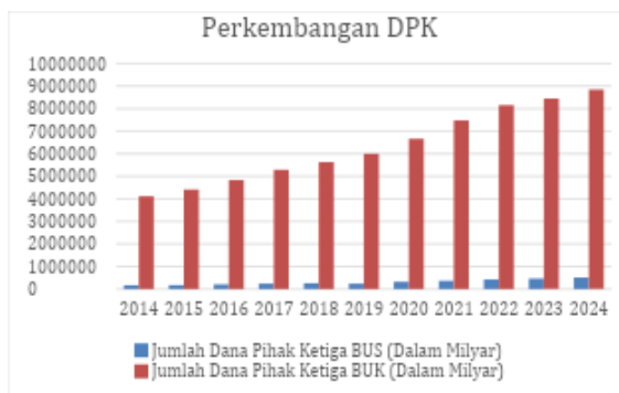
Gambar 1. Perkembangan DPK Perbankan Syariah dan Konvensional

Namun, dinamika penghimpunan DPK tidak hanya dipengaruhi oleh faktor internal perbankan, seperti tingkat bagi hasil, efisiensi operasional, dan inovasi produk, tetapi juga oleh faktor-faktor eksternal makroekonomi (Saputri & Hannase, 2021). Beberapa variabel makro yang sering dikaitkan dengan DPK antara lain inflasi, suku bunga, indeks harga saham gabungan (IHSG), produk domestik bruto (PDB), dan harga emas. Menurut teori Keynes, inflasi memiliki hubungan yang kompleks dengan keputusan menabung (Sobana, Hamzah, & Habibah, 2021). Ketika inflasi meningkat, masyarakat cenderung mengalihkan dananya ke aset-aset riil untuk mempertahankan nilai kekayaan (Salma & Nena, 2021; Soekapdjo, 2021). Namun dalam konteks tertentu, jika inflasi tidak terlalu tinggi dan diiringi dengan meningkatnya suku bunga atau bagi hasil, masyarakat justru dapat terdorong untuk menabung lebih banyak agar mendapatkan imbal hasil yang lebih tinggi, meskipun secara tidak langsung (Aldiansyah & Rahma, 2023; Kristina & Esya, 2022). Dengan demikian, inflasi dapat berpengaruh terhadap DPK baik secara positif maupun negatif, tergantung pada persepsi masyarakat terhadap stabilitas nilai uang dan return simpanan.