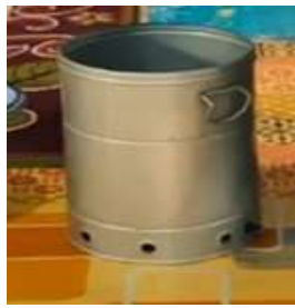
Tabung bagian luar