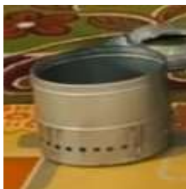
Tabung bagian dalam