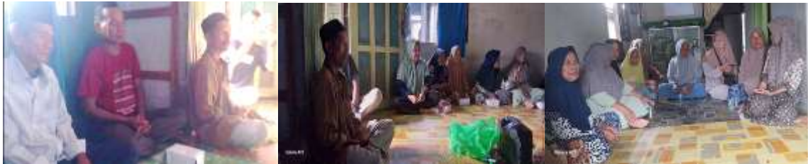
Gambar 1. Peserta Kegiatan

Kegiatan pengabdian masyarakat ini terlaksana dengan baik dan memperoleh antusiasme tinggi dari peserta. Seluruh anggota Kelompok Tani Hidayah hadir secara penuh dan aktif mengikuti setiap tahapan, mulai dari sesi sosialisasi, pelatihan, hingga evaluasi. Pendekatan berbasis komunitas yang diterapkan terbukti efektif dalam meningkatkan keterlibatan masyarakat karena metode ini menekankan aspek learning by doing —belajar langsung dari praktik nyata sesuai kebutuhan lokal. Dokumentasi peserta kegiatan dapat dilihat pada gambar 1.