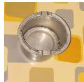
Tempat bahan bakar