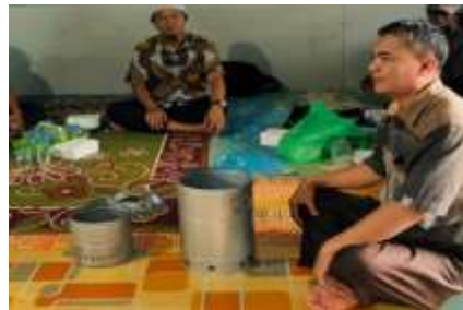
Gambar 2. Penjelasan tentang materi pelatihan

Pada sesi pelatihan, peserta diperkenalkan pada konsep dasar biomassa, prinsip kerja efek termoelektrik, dan potensi sekam padi sebagai sumber energi alternatif. Tim pelaksana kemudian memfasilitasi praktik langsung pembuatan kompor biomassa yang terdiri atas beberapa komponen utama, yaitu: Tabung pembakaran utama dari bahan baja tipis sebagai wadah utama sekam padi; Tabung dalam ( inner chamber ) untuk memaksimalkan proses oksidasi; Ventilasi udara di bagian bawah agar pembakaran lebih stabil; dan Modul Peltier yang dipasang pada sisi luar tabung untuk mengubah energi panas menjadi energi listrik.