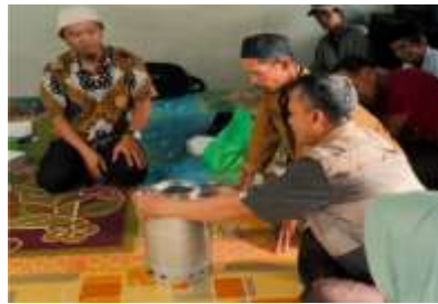
Gambar 4. Demonstrasi cara perakitan dan penggunaan kompor biomassa

Selama demonstrasi, masyarakat dilatih untuk merakit setiap bagian secara mandiri dengan alat sederhana seperti bor, obeng, dan las kecil. Proses pembakaran sekam padi menghasilkan panas sekitar 300–400°C, yang cukup untuk mengaktifkan modul Peltier. Hasil uji coba menunjukkan bahwa kompor mampu menghasilkan tegangan listrik 1,8–2, 2volt yang dapat menyalakan lampu LED berdaya rendah (3–5 watt) secara stabil selama pembakaran berlangsung [1], [5].