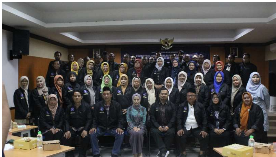
Gambar 1. Sesi dokumentasi Pengabdian Kepada Masyarakat

Sesi terakhir adalah penutup acara, yang dipandu oleh panitia. Acara ditutup dengan ucapan terima kasih kepada narasumber, fasilitator, peserta, serta seluruh pihak yang mendukung terselenggaranya kegiatan ini. Selanjutnya dilakukan sesi dokumentasi berupa foto bersama, yang menjadi bukti kebersamaan sekaligus kenangan dari kegiatan. Dokumentasi ini juga penting sebagai laporan resmi dan publikasi kegiatan MGMP IPS Lamongan.