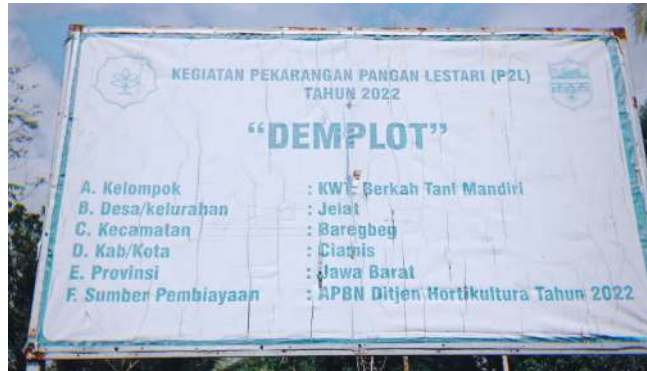
Gambar 3. Demplot KWT: Berkah Tani Mandiri

Setelah dilakukan penyemaian bibit tomat memerlukan waktu sekitar 15 hari untuk dapat di pindahkan ke demplot tempat menanam benih.