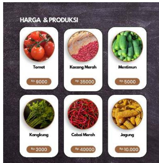
Gambar 4. Pamflet Pemasaran

Evaluasi terhadap kegiatan penanaman dan pemasaran digital kepada Kelompok Wanita Tani Berkah Tani Mandiri yang dilaksanakan oleh Mahasiswa kelompok 3 Fisip Universitas Galuh di Desa Jelat tepatnya di Dusun Nanggewer. Kegiatan ini berhasil menyampaikan edukasi mengenai pentingnya pemasaran digital untuk membantu meningkatkan hasil dan pendapatan dari produk kelompok Wanita tani tersebut.