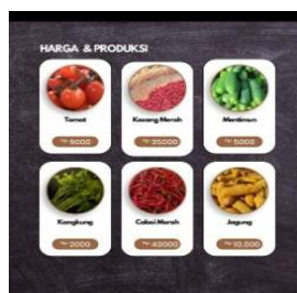
Gambar 5. Screenshot Promisi pemasaran

Berikut contoh iklan pemasaran berbentuk pamflet yang menjadi media promosi ibu-ibu KWT: Berkah Tani Mandiri Dusun Nanggewer Desa Jelat.