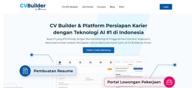
Gambar 5. Tampilan Halaman Depan Platform Kinobi CV