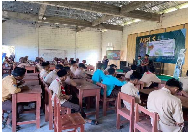
Gambar 1. Pembukaan Acara

Kegiatan ini dimulai pada pukul 09.00 WIB yang dibuka oleh Moderator yang diawali dengan perkenalan dan dilanjutkan menjelaskan maksud serta tujuan diadakannya kegiatan, mulai dari pembacaan susunan acara dan pengenalan pemateri. Pada pembukaan ini ketua pelaksana dan kepala madrasah ikut memberikan sambutan yang membangkitkan semangat peserta, mereka juga mengajak peserta untuk aktif dalam setiap sesi diskusi berlangsung dan mencatat poin-poin penting yang bisa dijadikan pembelajaran untuk mereka.