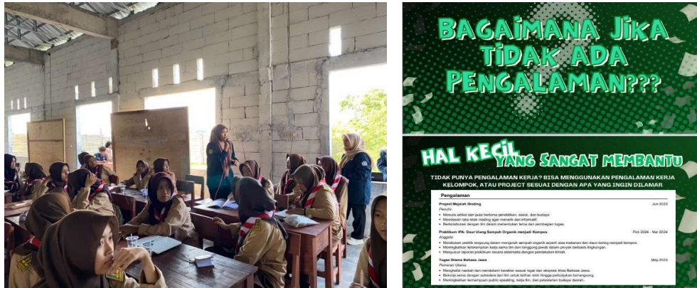
Gambar 3. Sesi Diskusi Seputar CV ATS

pengalaman organisasi maupun kerja, apa yang bisa dimasukkan kedalam CV. Sesi ini menjadi penting dalam kegiatan pelatihan karena tidak hanya memperdalam pemahaman peserta tetapi juga mendorong mereka untuk lebih percaya diri dalam menuliskan pengalaman dan keunggulan diri.