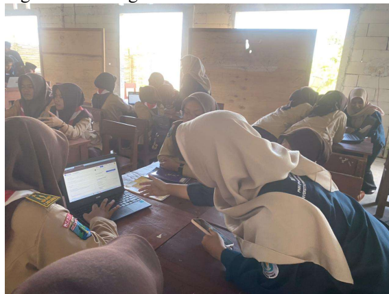
Gambar 4. Praktek Pembuatan CV ATS Menggunakan Platfrom Kinobi

Kegiatan praktik ini diawali dengan pemaparan dari pemateri mengenai cara mendaftar akun pada platform kinobi serta penjelasan penggunaan fitur. Setelah itu, pemateri memberikan panduan langkah demi langkah dalam mengisi data yang diperlukan untuk membuat CV ATS Friendly seperti data diri, riwayat pendidikan, pengalaman, keterampilan. Setelah pemateri menjelaskan, peserta mempraktikkan secara langsung pembuatan CV melalui akun kinobi yang masing masing didampingi oleh pendamping kelompok. Selama sesi praktik berlangsung, pemateri dan pendamping kelompok juga membantu peserta yang merasa kesusahan memahami elemen penting yang dapat meningkatkan kualitas CV agar sesuai dengan kriteria ATS.