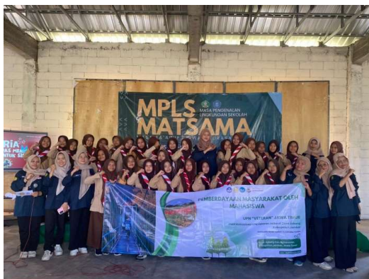
Gambar 8. Dokumentasi Bersama Peserta Pelatihan

Kegiatan diakhiri dengan sesi penutupan yang diawali dengan pembacaan kesimpulan dari seluruh rangkaian acara pelatihan. Setelah itu, tim pelaksana menyampaikan ucapan terima kasih kepada pihak Yayasan MA As-Shofa yang telah memberikan izin dan dukungan penuh sehingga kegiatan dapat berjalan dengan lancar. Sebagai bentuk apresiasi dan motivasi, tim juga memberikan bingkisan dan cendera mata kepada pihak yayasan serta perwakilan peserta sebagai dorongan agar terus semangat mengembangkan potensi diri dan meningkatkan keterampilan dalam mempersiapkan diri menghadapi dunia kerja. Acara ditutup dengan sesi dokumentasi, yaitu foto bersama seluruh peserta, pemateri, pihak yayasan, dan tim pelaksana sebagai kenang-kenangan sekaligus bukti pelaksanaan kegiatan.