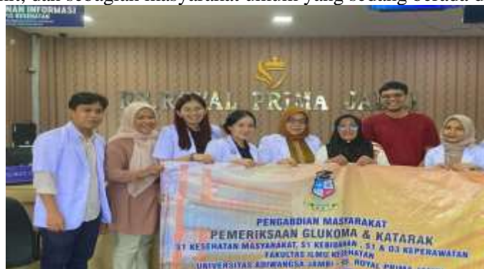
Gambar 2. Foto Dokumen 1

Kegiatan pengabdian kepada masyarakat dengan tema “Edukasi dan Pemeriksaan Kesehatan Mata” telah dilaksanakan pada Sabtu, 1 November 2025 pukul 08.00 WIB, bertempat di Ruang Tunggu (Lobi) Rumah Sakit Royal Prima Jambi. Kegiatan ini berjalan dengan lancar dan mendapatkan sambutan positif dari pihak manajemen rumah sakit, tenaga kesehatan, serta pengunjung dan keluarga pasien yang hadir. Total peserta yang mengikuti kegiatan ini sebanyak 40 orang terdiri atas keluarga pasien, pengunjung rumah sakit, dan sebagian masyarakat umum yang sedang berada di area lobi.