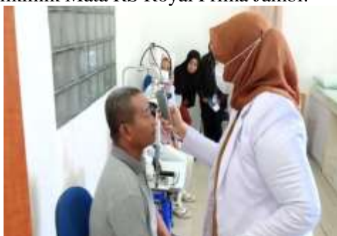
Gambar 3. Screening Mata

Setelah edukasi, kegiatan dilanjutkan dengan pemeriksaan tajam penglihatan (skrining mata) menggunakan Snellen chart dan E-chart (Gambar.3). Pemeriksaan dilakukan oleh tim dosen dan mahasiswa keperawatan yang telah mendapatkan pembekalan sebelumnya. Setiap peserta diperiksa secara bergantian dengan menjaga jarak pemeriksaan 6 meter sesuai standar. Hasil pemeriksaan menunjukkan bahwa sekitar 12 orang (30%) peserta mengalami penurunan tajam penglihatan ringan hingga sedang, sementara 28 orang (70%) peserta memiliki tajam penglihatan normal. Peserta yang ditemukan memiliki gangguan penglihatan diberikan edukasi lanjutan serta anjuran untuk melakukan pemeriksaan lebih lanjut ke Poliklinik Mata RS Royal Prima Jambi.