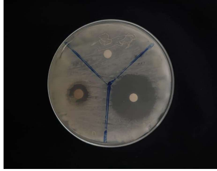
Gambar 5 : Gambar Hasil Uji Anti bakteri dengan DMSO (Dimetil Sulfoksida)

Zona hambat adalah area bening di sekitar cakram uji atau sumur yang menunjukkan kemampuan suatu zat, seperti ekstrak daun senduduk, dalam menghambat pertumbuhan bakteri. Pada pengujian antibakteri dengan ekstrak etanol daun senduduk terhadap bakteri pada saluran hidung, terlihat adanya pembentukan zona hambat yang cukup jelas. Uji aktivitas antibakteri terhadap ekstrak daun senduduk ( Melastoma malabathricum L. ) dilakukan menggunakan metode difusi cakram dengan membandingkan daya hambat ekstrak terhadap dua kontrol, yaitu kontrol negatif DMSO (Dimetil Sulfoksida) dan kontrol positif Ciprofloxacin HCl. Hasil pengamatan menunjukkan adanya perbedaan nyata pada zona bening (zona hambat) di sekitar cakram yang mengindikasikan tingkat aktivitas antibakteri dari masing-masing perlakuan. Menurut Greenwood (1995), klasifikasi respon hambatan pertumbuhan bakteri sebagai berikut: diameter zona hambat <10 mm dikategorikan tidak ada hambatan, zona hambat 10-15 mm dikategorikan lemah, zona hambat 16-19 mm dikategorikan sedang dan zona hambat >20 mm dikategorikan kuat.