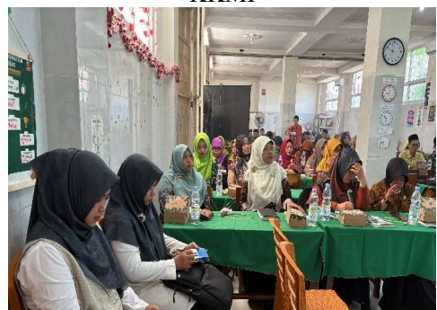
Gambar 4. Peserta PkM antusias menyimak materi