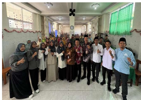
Gambar 5. Tim PkM berfoto bersama

Hasil kegiatan menunjukkan bahwa penguatan pemahaman dan internalisasi nilai-nilai Ahlu Sunnah wal Jama'ah (Aswaja) sangat relevan dengan kebutuhan guru Madrasah Ibtidaiyah (MI) di Kota Semarang. Dalam konteks pendidikan dasar Islam, guru memiliki posisi strategis sebagai pendidik sekaligus pembentuk karakter moderat bagi peserta didik. Melalui pelatihan intensif, kegiatan ini membuktikan bahwa pemahaman nilai-nilai Aswaja mampu menjadi benteng moderasi beragama yang efektif di tengah tantangan globalisasi, arus informasi digital, serta meningkatnya wacana keagamaan yang ekstrem. Pemahaman terhadap Aswaja meneguhkan identitas keislaman yang moderat, toleran, dan kontekstual. Guru MI yang memiliki landasan ideologis Aswaja akan lebih siap dalam menuntun siswa untuk memahami perbedaan dengan sikap bijak dan damai. Hal ini sejalan dengan penelitian sebelumnya yang menyatakan bahwa pendidikan Aswaja berperan penting dalam memperkuat sikap keberagaman yang inklusif dan mencegah penetrasi ideologi intoleran di lingkungan Pendidikan (Suyani et al., 2025). Penguatan nilai Aswaja juga mendukung visi Moderasi Beragama yang digagas oleh Kementerian Agama RI, yakni menjadikan lembaga pendidikan Islam sebagai ruang tumbuhnya keislaman yang rahmatan lil 'alamin (RI, 2019).