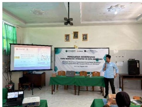
Gambar 3. Narasumber PkM