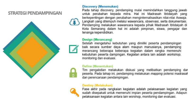
Gambar 1. Strategi Pendampingan

fokus pengabdian (Kurniawan & Lionardo, 2020). Adapun strategi pelaksanaan pengabdian ini dirancang melalui beberapa tahapan (Dureau, n.d.), yaitu: