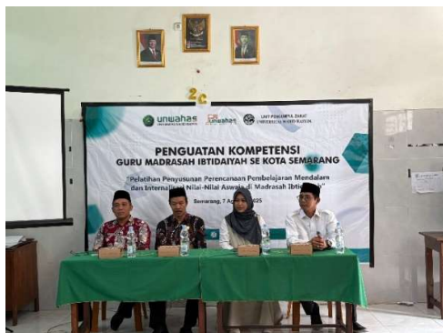
Gambar 2. Pembukaan Tim PkM dan Ketua KKMI

non-formal madrasah seperti pembiasaan harian dan kegiatan ekstrakurikuler. (3) Produk Akhir: Modul Ajar Berbasis Aswaja, salah satu capaian penting dari program ini adalah tersusunnya modul ajar berbasis Aswaja yang dapat digunakan oleh guru MI di Kota Semarang. Modul ini berisi: Konsep dasar Aswaja dalam akidah, fikih, dan tasawuf, strategi integrasi nilai Aswaja dalam pembelajaran tematik serta contoh modul ajar yang memuat nilai tawasuth, tawazun, tasamuh, dan i'tidal. (4) Dampak terhadap Komitmen Guru MI, program pengabdian berhasil menumbuhkan kesadaran kolektif di kalangan guru untuk berperan sebagai agen moderasi beragama. Hal ini tampak dari adanya inisiatif guru untuk membentuk forum kecil diskusi rutin Aswaja di beberapa madrasah, sebagai tindak lanjut dari kegiatan ini.