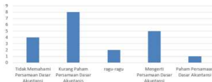
Grafik 2. Tingkat Pemahaman Peserta Di Awal Pelatihan

Hasil analisis terhadap data yang dikumpulkan dari pembagian kuesioner kepada peserta pelatihan persamaan dasar akuntansi pada awal pertemuan ditunjukkan oleh Grafik 2. Grafik 2 menunjukkan terdapat 4 peserta yang tidak memahami persamaan dasar akuntansi atau belum pernah memperoleh pelajaran atau pelatihan yang berkaitan dengan persamaan dasar akuntansi. terdapat delapan peserta yang masih kurang memahami persamaan dasar akuntansi meski pernah memperoleh pelajaran atau pelatihan yang berkaitan dengan persamaan dasar akuntansi. Terdapat dua peserta pelatihan dasar akuntansi yang ragu-ragu dalam menjawab apakah sudah paham dan mampu melakukan pencatatan dalam persamaan dasar akuntansi. terdapat lima peserta yang mengerti persamaan dasar akuntansi. dari grafik 2 tersebut terdapat satu peserta yang memahami persamaan dasar akuntansi dan mampu menyusun transaksi dalam persamaan akuntansi. Terdapat 20 peserta dalam pelatihan persamaan dasar akuntansi. dari hasil analisis pada grafik 2 dapat digolongkan menjadi tiga secara garis besar. Pertama, peserta yang belum mengerti terhadap persamaan dasar akuntansi terdiri dari dua belas peserta. Dua, orang peserta pelatihan