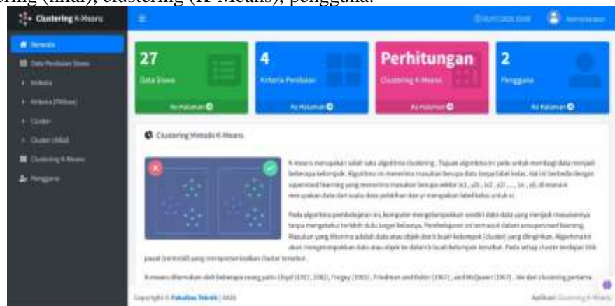
Gambar 3. Tampilan Menu Dashboard

Tampilan Menu Dashboard terdiri dari beranda, data penilaian siswa, kriteria, kriteria (pilihan), cluster, clustering (nilai), clustering (K-Means), pengguna.