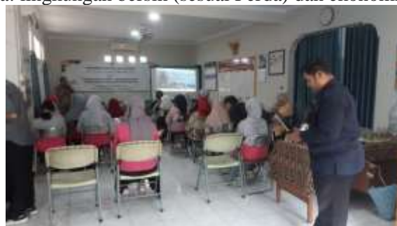
Gambar 2. Suasana Kegiatan PKM

Peningkatan pemahaman terhadap konsep Reuse dan Recycle (khususnya untuk plastik dan kertas) memberikan titik tolak bagi Kewirausahaan Hijau. Ketika masyarakat menyadari bahwa sampah anorganik yang terpilah memiliki nilai ekonomi, motivasi untuk mematuhi Perda (melalui pemilahan) secara otomatis meningkat. Program ini menunjukkan bahwa regulasi pemerintah dapat didukung dan diperkuat oleh insentif ekonomi. Penguatan Kewirausahaan Hijau ini menjadi solusi sirkular yang memberikan dampak ganda: lingkungan bersih (sesuai Perda) dan ekonomi masyarakat meningkat.