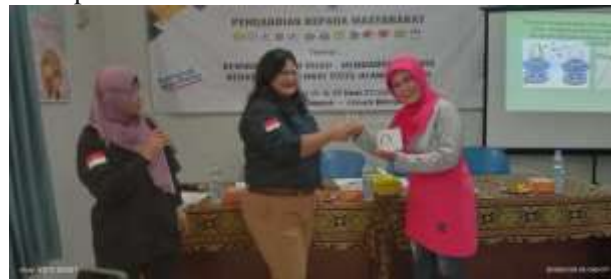
Gambar 1. Pemberian Penghargaan Kepada Peserta PKM

Secara keseluruhan, rata-rata skor peserta meningkat dari 48% (Pre-test) menjadi 89% (Post-test). Peningkatan tertinggi (kategori "Tinggi") tercatat pada pemahaman terhadap Perda No. 5/2014 dan konsep 3R. Hal ini mengindikasikan bahwa peserta sebelumnya mengalami kekurangan informasi yang substansial pada kedua aspek tersebut.