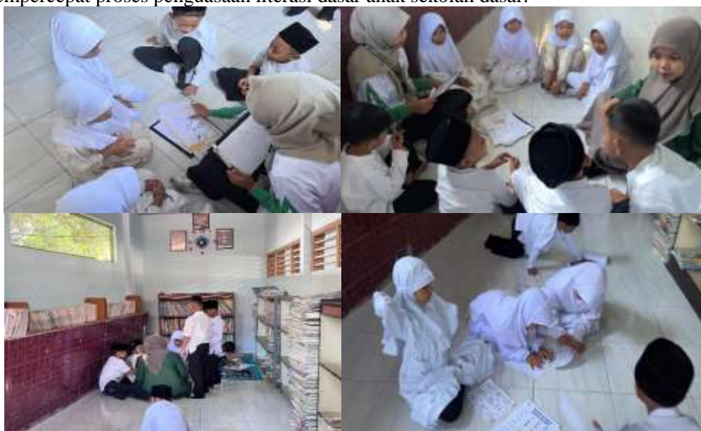
Gambar 1. Dokumentasi Kegiatan Program Klinik Literasi

Kegiatan pendampingan membaca dilaksanakan dua kali seminggu, setiap hari Jumat dan Sabtu. Setiap pertemuan dirancang dengan metode yang bervariasi seperti membaca bersama, permainan suku kata, dan latihan pengucapan kata bergambar. Pendekatan ini menciptakan suasana belajar yang menyenangkan dan tidak menegangkan bagi anak. Selain itu, variasi metode ini membantu siswa untuk berlatih membaca dengan cara yang berbeda setiap kali pertemuan, sehingga mencegah rasa bosan dan menumbuhkan semangat belajar yang lebih tinggi. Temuan ini sejalan dengan hasil penelitian Fitrih, Rosita, dan Koesmini (2025) yang menunjukkan bahwa penerapan program klinik baca secara kreatif dapat mempercepat proses penguasaan literasi dasar anak sekolah dasar.