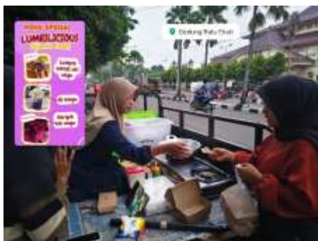
Gambar 6. Implementasi Produksi dan Pemasaran

daring. Respon masyarakat sangat positif dan beberapa pesanan mulai diterima. Tahap ini menunjukkan keberhasilan pesantren dalam mengaplikasikan konsep OPOP secara nyata. Ke depan, diharapkan usaha ini dapat berkembang menjadi unit bisnis berkelanjutan yang mendukung peningkatan kesejahteraan ekonomi warga pesantren dan memperkuat kemandirian ekonomi berbasis pesantren. Adapun dokumentasi Implementasi Produksi dan Pemasaran dapat dilihat pada gambar 6.