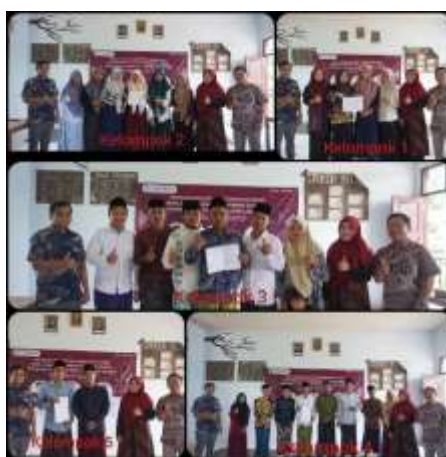
Gambar 5. Presentasi Rencana Usaha dengan BMC

Setelah dilaksanakan pelatihan awal, selanjutnya pada Kamis 23 Oktober 2025 dilaksanakan pelatihan lanjutan dengan agenda presentasi rencana usaha dan diskusi. Ketiga kelompok telah mendapatkan ide untuk rencana produk usaha mereka yaitu produk olahan dari ubi ungu (kelompok 1), brownies (kelompok 2), kopi jahe (kelompok 3), kaos kata-kata unik khas santri (kelompok 4) dan miekita (kelompok 5). Setiap kelompok mempresentasikan rencana usahanya dan diberikan pertanyaan, masukan serta saran pada sesi diskusi. Setelah semua kelompok mempresentasikan, akhirnya kami sepakat memilih ide usaha dari kelompok 1 untuk diimplementasikan menjadi usaha unggulan dari Pondok Pesantren Yanbu'ul Hikmah Bangkalan sehingga nantinya dapat merealisasikan OPOP ( One Pesantren One Product ). Adapun dokumentasi setiap kelompok mempresentasikan hasil karya produknya dapat dilihat pada gambar 5.