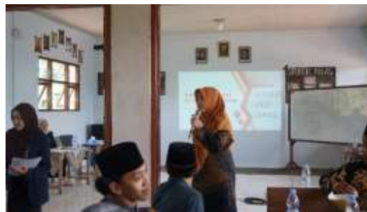
Gambar 2. Pemaparan Materi Perencanaan Usaha dengan BMC