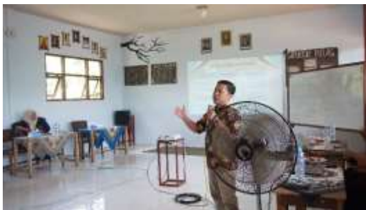
Gambar 1. Pemaparan Materi Pengantar Kewirausahaan dan OPOP