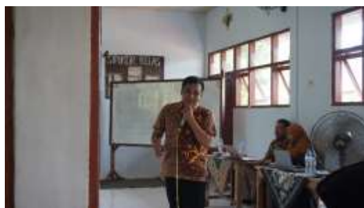
Gambar 3. Pemaparan Materi Pemasaran dan Keuangan berbasis Digital

Setelah diberikan materi, peserta pelatihan dibagi menjadi lima kelompok. Tujuan dari dibentuknya kelompok agar untuk lebih memudahkan dalam merencanakan dan mengimplementasikan usaha berbasis OPOP ( One Pesantren One Product ). Kemudian, aktivitas selanjutnya adalah pengarahannya tugas peserta. Setiap kelompok berisikan para asatidz, asatidzah dan dibantu oleh para santri untuk berdiskusi merencanakan usahanya dengan bantuan BMC (Business Model Canvas). Lima kelompok telah terbagi dan akan mempresentasikan rencana usahanya pada pertemuan berikutnya. Adapun dokumentasi sesi foto bersama setelah pelatihan dapat dilihat pada gambar 4.