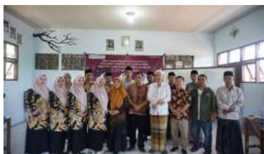
Gambar 4. Dokumentasi Foto Bersama

Setelah diberikan materi, peserta pelatihan dibagi menjadi lima kelompok. Tujuan dari dibentuknya kelompok agar untuk lebih memudahkan dalam merencanakan dan mengimplementasikan usaha berbasis OPOP ( One Pesantren One Product ). Kemudian, aktivitas selanjutnya adalah pengarahannya tugas peserta. Setiap kelompok berisikan para asatidz, asatidzah dan dibantu oleh para santri untuk berdiskusi merencanakan usahanya dengan bantuan BMC (Business Model Canvas). Lima kelompok telah terbagi dan akan mempresentasikan rencana usahanya pada pertemuan berikutnya. Adapun dokumentasi sesi foto bersama setelah pelatihan dapat dilihat pada gambar 4.