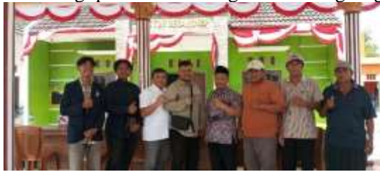
Gambar 2. Kegiatan Sosialisasi

Pada tahap ini, tim pengabdian melakukan kegiatan sosialisasi dan bekerja sama dengan mitra untuk menyamakan persepsi tentang tujuan, keuntungan, dan rencana pelaksanaan kegiatan. Sosialisasi dilakukan secara partisipatif dengan melibatkan pengurus kelompok tani dan perangkat Desa, dan mitra berpartisipasi aktif dengan memberikan gambaran kondisi usaha dan masalah yang dihadapi dalam hal pemasaran dan pengemasan produk. Tahap ini memungkinkan tim pengabdian dan mitra memahami apa yang akan dilakukan dan membagi peran selama kegiatan berlangsung.