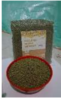
Gambar 4. Kemasan Produk Hasil Pertanian

Mitra turut serta aktif dalam memberikan data hasil panen, mendemonstrasikan proses bisnis mereka, serta mencoba secara langsung strategi pemasaran digital yang telah diajarkan. Hasil dari tahap ini menunjukkan bahwa sebagian besar peserta sudah mampu membuat akun bisnis online dan mengunggah produk mereka ke platform digital.