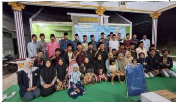
Gambar 3. Kegiatan pelatihan pemasaran digital

Pelatihan dilakukan secara interaktif melalui simulasi, diskusi, kuis, dan games agar peserta lebih antusias dan mudah memahami materi. Mitra menunjukkan partisipasi aktif dengan menyediakan tempat pelatihan, menghadirkan peserta, serta turut memberikan masukan dalam proses pelatihan.