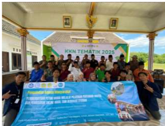
Gambar 5. Kegiatan Pendampingan Pengabdian

Setelah penerapan teknologi, tim pengabdian melakukan pendampingan secara langsung ke lokasi mitra. Pendampingan dilakukan untuk memastikan peserta dapat mengoperasikan platform digital dengan baik, memantau aktivitas promosi dan penjualan, serta memberikan solusi atas kendala teknis yang dihadapi.