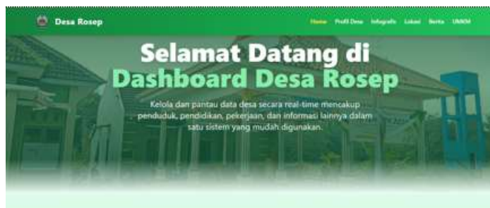
Gambar 6. Dashboar Website Desa